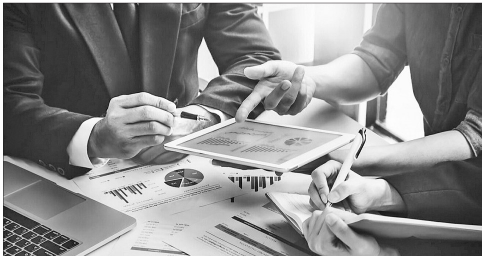
Підвищити ефективність влади допоможе цифровізація діяльності державного апарату та англійська, як мова міжнародного спілкування в держорганах

«Передусім маємо підвищити ефективність діяльності органів влади, а саме: провести цифровізацію діяльності державного апарату та всіх державних послуг; реформу оплати праці на основі класифікації посад (грейдової системи),