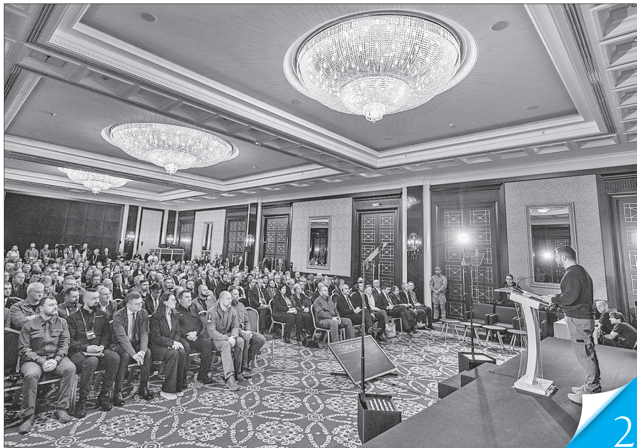
Володимир Зеленський під час Міжнародного форуму оборонних індустрій оголосив про створення Альянсу оборонних індустрій

РАЗОМ ДО ПЕРЕМОГИ. У Києві пройшов перший Міжнародний форум оборонних індустрій, в якому взяли участь Президент Володимир Зеленський та Прем'єр-міністр Денис Шмигаль