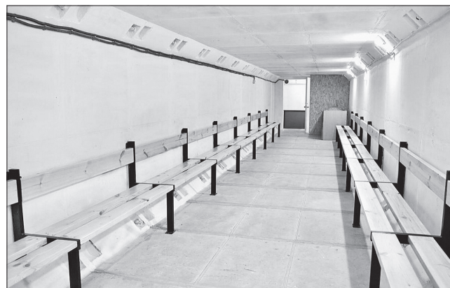
У таких умовах можна проводити уроки