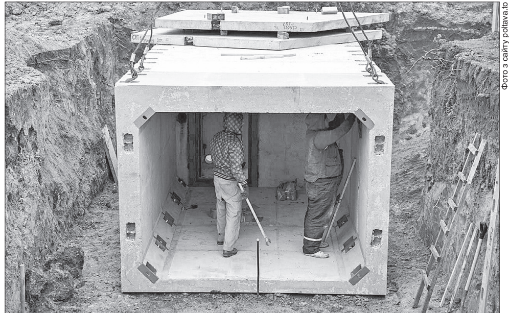
Встановлення найпростішого модульного укриття біля однієї зі шкіл

Наприкінці липня виконком Полтавської міської ради ухвалив будівництво двох тимчасових модульних укриттів на території загальноосвітньої школи №19 та гімназії №25 у Полтаві. У цих навчальних закладах немає підвалів, у яких можна було б облаштувати укриття, розповів начальник місь-