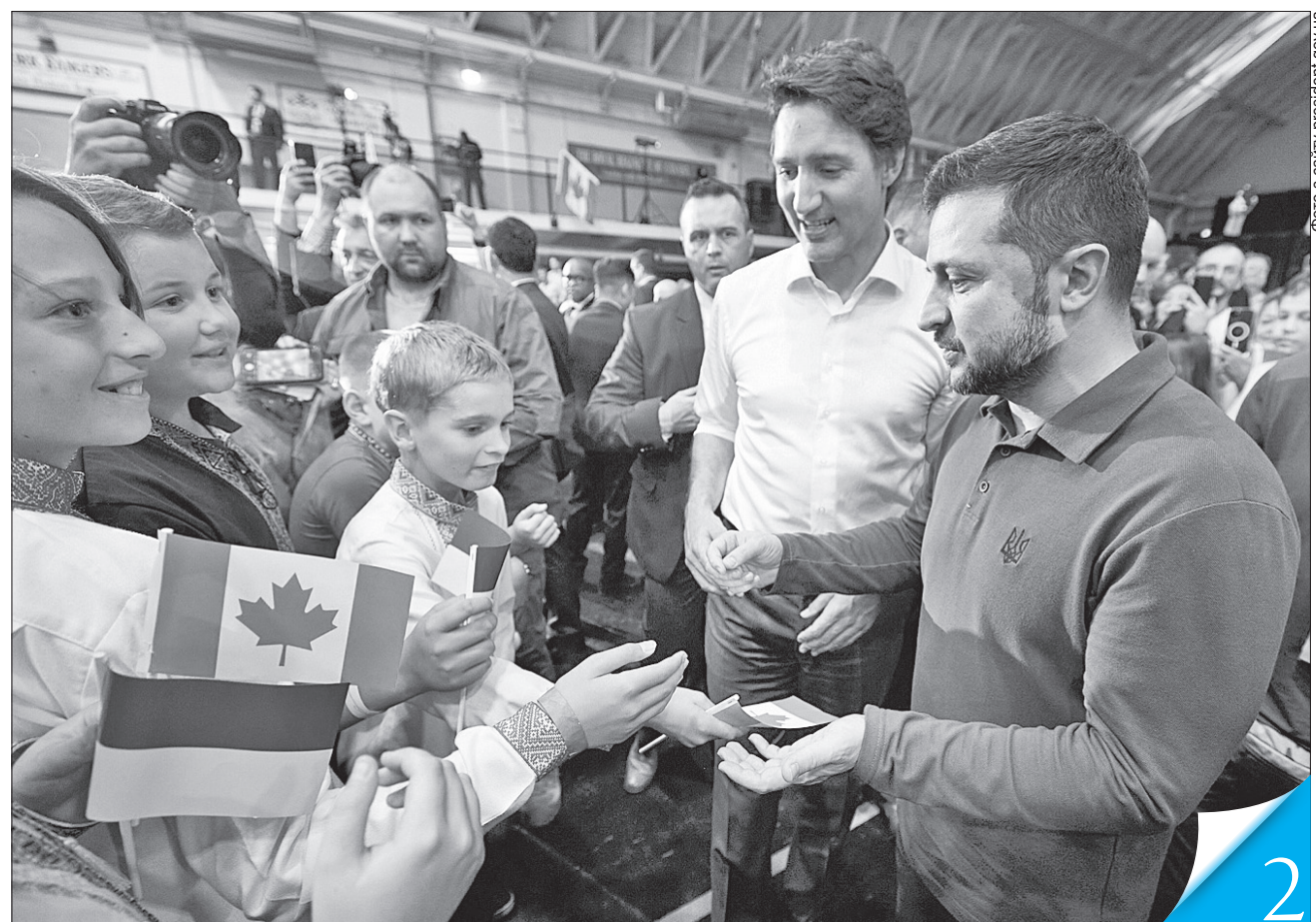
Президент України Володимир Зеленський і Прем'єр-міністр Канади Джастін Трюдо провели зустріч з представниками канадської громадськості

МІЖНАРОДНЕ ПАРТНЕРСТВО. Канада оголосила про надання нового пакета військової допомоги Києву під час візиту Президента Володимира Зеленського