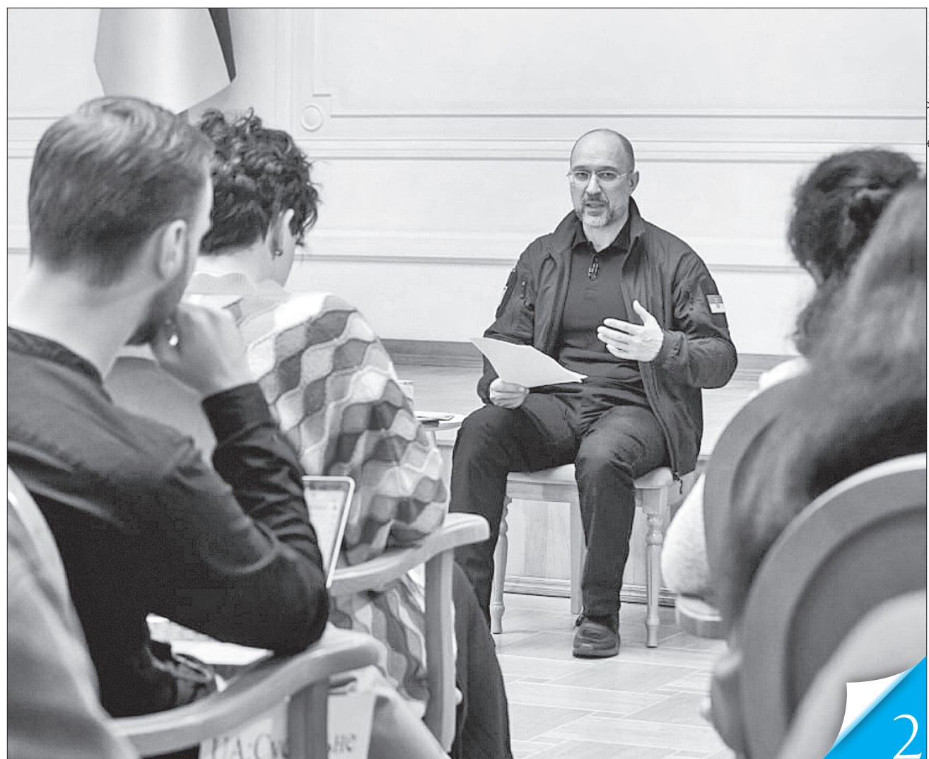
На пресконференції Прем'єр-міністр зазначив, що понад половину фінансових ресурсів країни піде на оборону й безпеку

АКТУАЛЬНО. Прийнятий учора урядом законопроект про Держбюджет-2024 вже у Верховній Раді