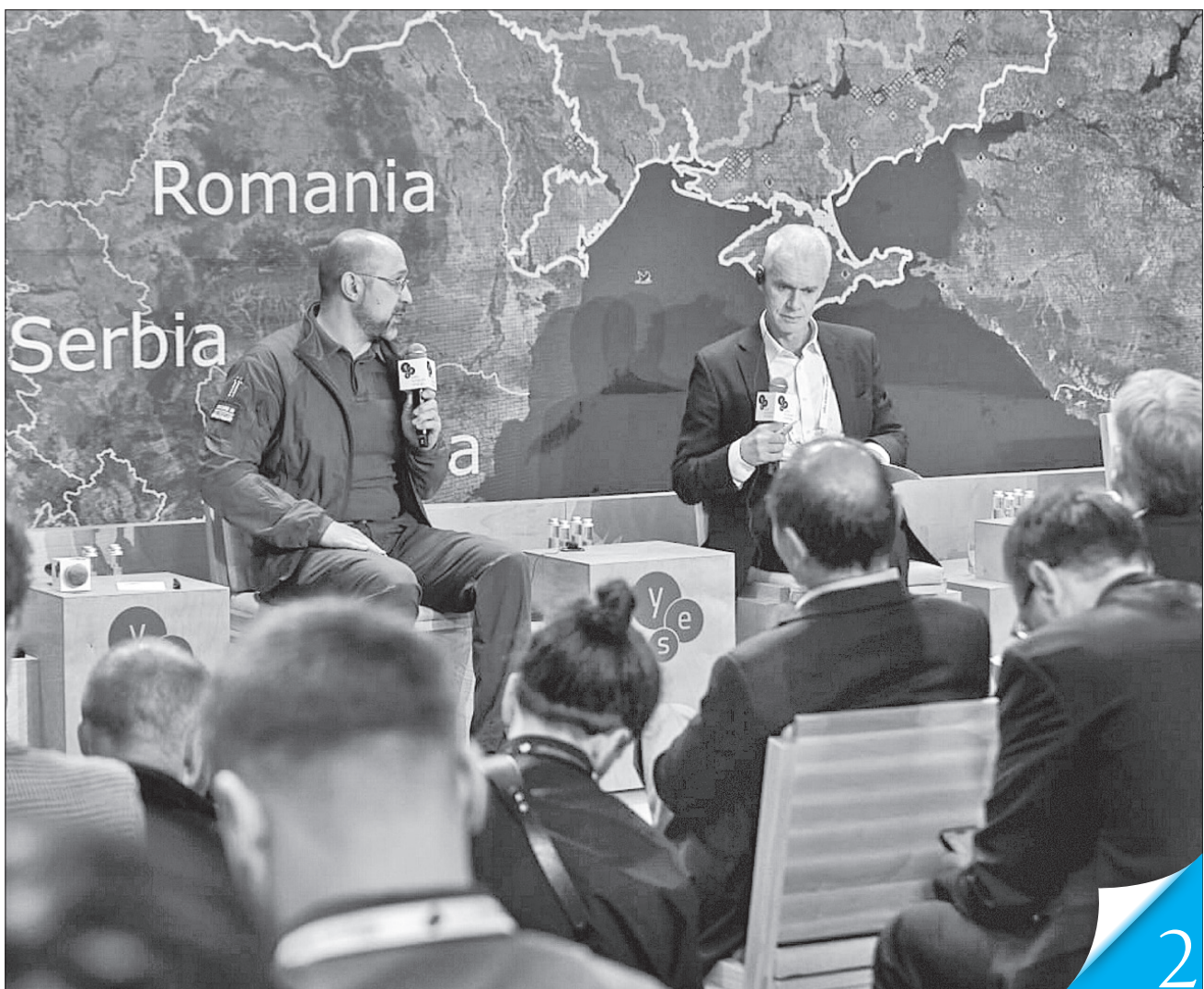
Прем'єр-міністр Денис Шмигаль говорив про три складові формування вітчизняної економіки

ФОРУМ. Тема нинішнього засідання Ялтинської європейської стратегії охоплювала зокрема погляд на економіку воєнного часу, економіку відновлення та економіку майбутнього