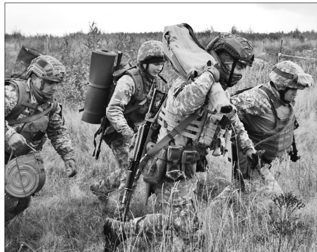
Фонд військової допомоги фінансуватиме також тренування українців у межах навчальної місії ЄС EUMAM

«Тут важливі дві речі: по-перше, показати світу, що наші зобов'язання непохитні, це політичний сигнал, що в довгостроковій перспективі ми збираємося безпеково підтримувати Україну стіль-