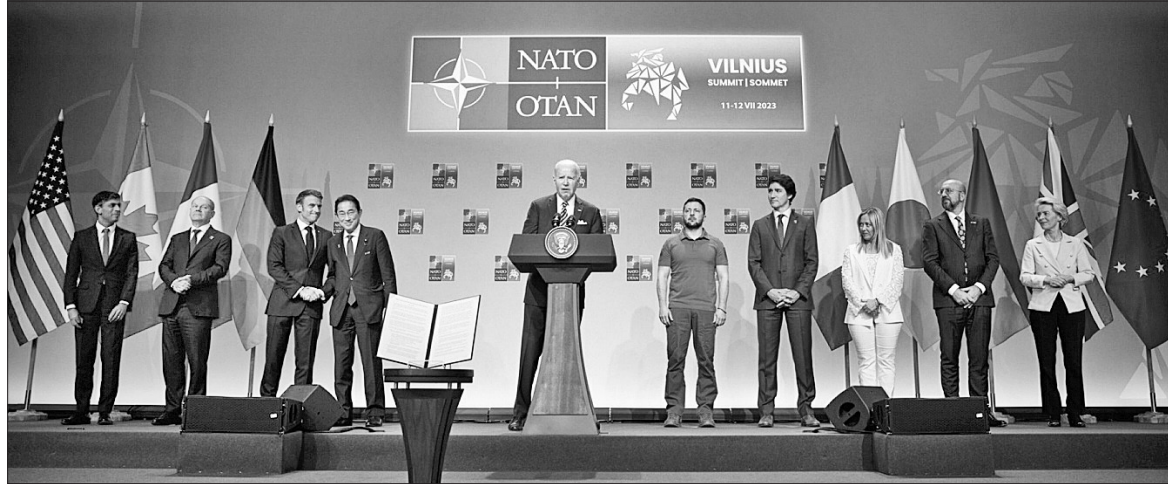
Президент США Джо Байден наголосив, що країни G7 допоможуть нам побудувати потужну, боєздатну оборону на суші, в повітрі та на морі, яка буде опорою для стабільності в регіоні

«Розумію, що це технічний сигнал. Але для мене це був дуже важливий момент. Я порівнюю це з кандидатством у Європейському Союзі. Це так са-