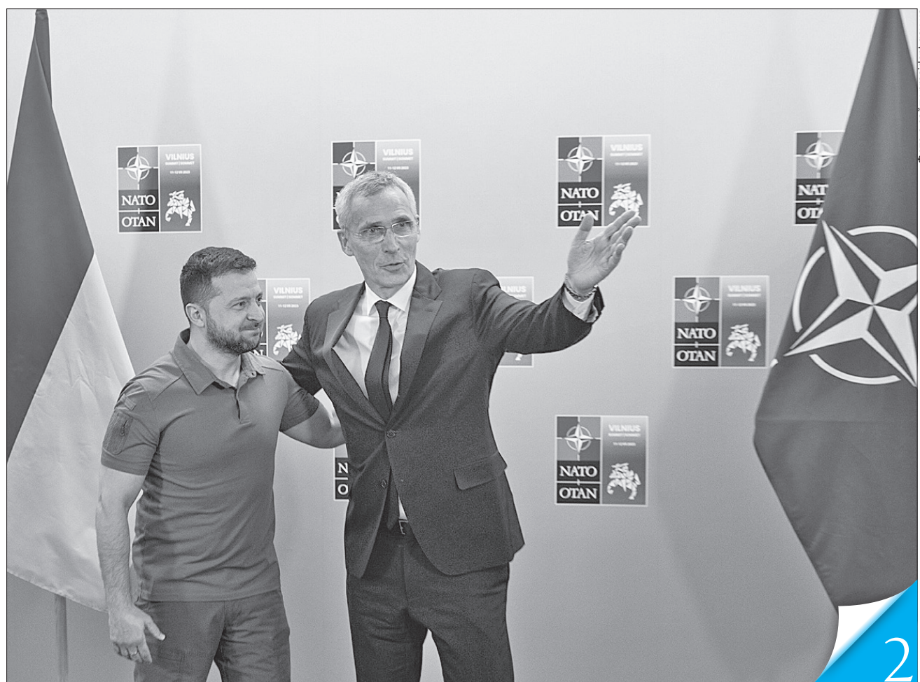
Єнс Столтенберг — Володимирові Зеленському: ми підтверджуємо, що місце України — в НАТО

ІНТЕГРАЦІЯ. Підсумки саміту Північноатлантичного альянсу у Вільнюсі Президент Володимир Зеленський назвав добрими, але якби було запрошення нашої держави до цієї організації, то вони стали б ідеальними