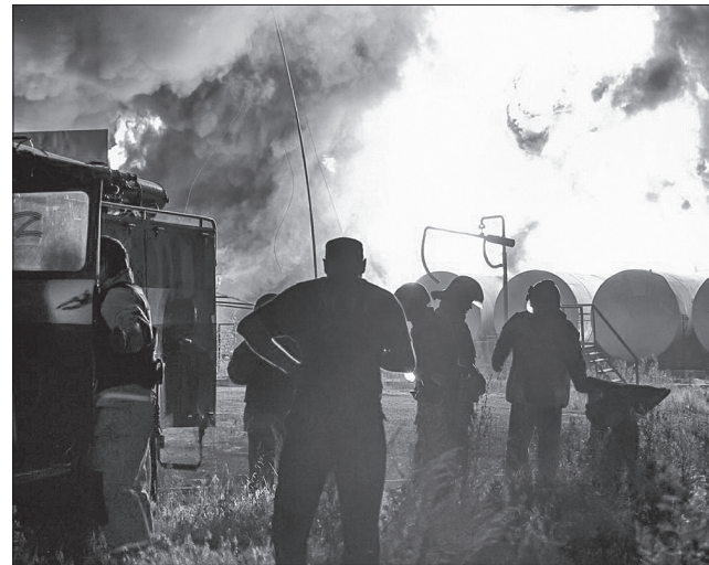
На нафтобазі в Макіївці добре горять цистерни з паливом

«Те, що вибухнув склад боєкомплекту, було зрозуміло відразу. Бо навіть нашу багатоповерхівку добряче струснуло. Ми дуже чітко почули гучний звук, а потім побачили яскраву заграву та високий стовп диму над Макіївкою. Трохи згодом у соціальних мережах з'явилися фото потерпілих будинків та медичного закладу, та було очевидно, що вибух був не там, а десь поряд в іншому місці. Бо хіба могло б щось так вибухати та горіти у житловому кварталі? І звідкіля взялися снаряди, які летіли у різні боки, а де вони падали, то теж спалахував вогонь», — згадує про події «бавовняного» вечора 4 липня житель сусіднього з Макіївкою Калінінського району Донецька.