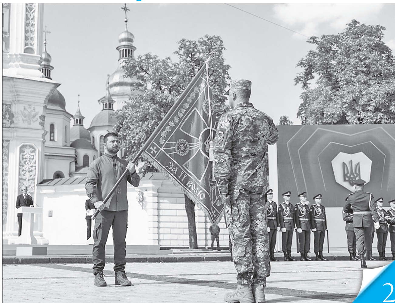
Президент Володимир Зеленський вручив бойові прапори підрозділам Збройних сил ЗСУ

РАЗОМ ДО ПЕРЕМОГИ. На столичній Софійській площі під знаком боротьби із загарбником пройшли урочистості з нагоди головного державного свята