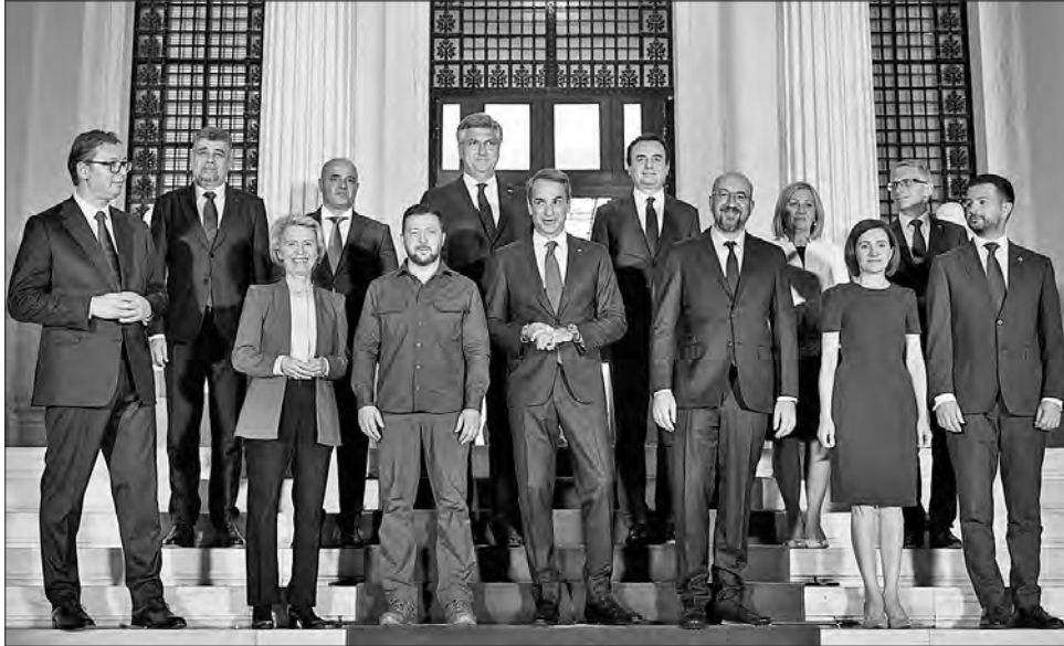
Лідери країн Південно-Східної Європи та України підписали Афінську декларацію на підтримку територіальної цілісності нашої держави

У декларації щодо України країни заявили, що перед викликом російської агресії вони висловлюють свою непохитну підтримку незалежності, суверенітету і територіальній цілісності нашої держави в межах її міжнародно визнаних кордонів, «що ґрунтується на цінностях демократії та верховенства права». У документі зазначено, що країни Західних Балкан, Україна і Молдова, які географічно прилягають до країн-членів ЄС, «мають спільну європейську спадщину, історію та майбутнє, визначене спільними можливостями й викликами».