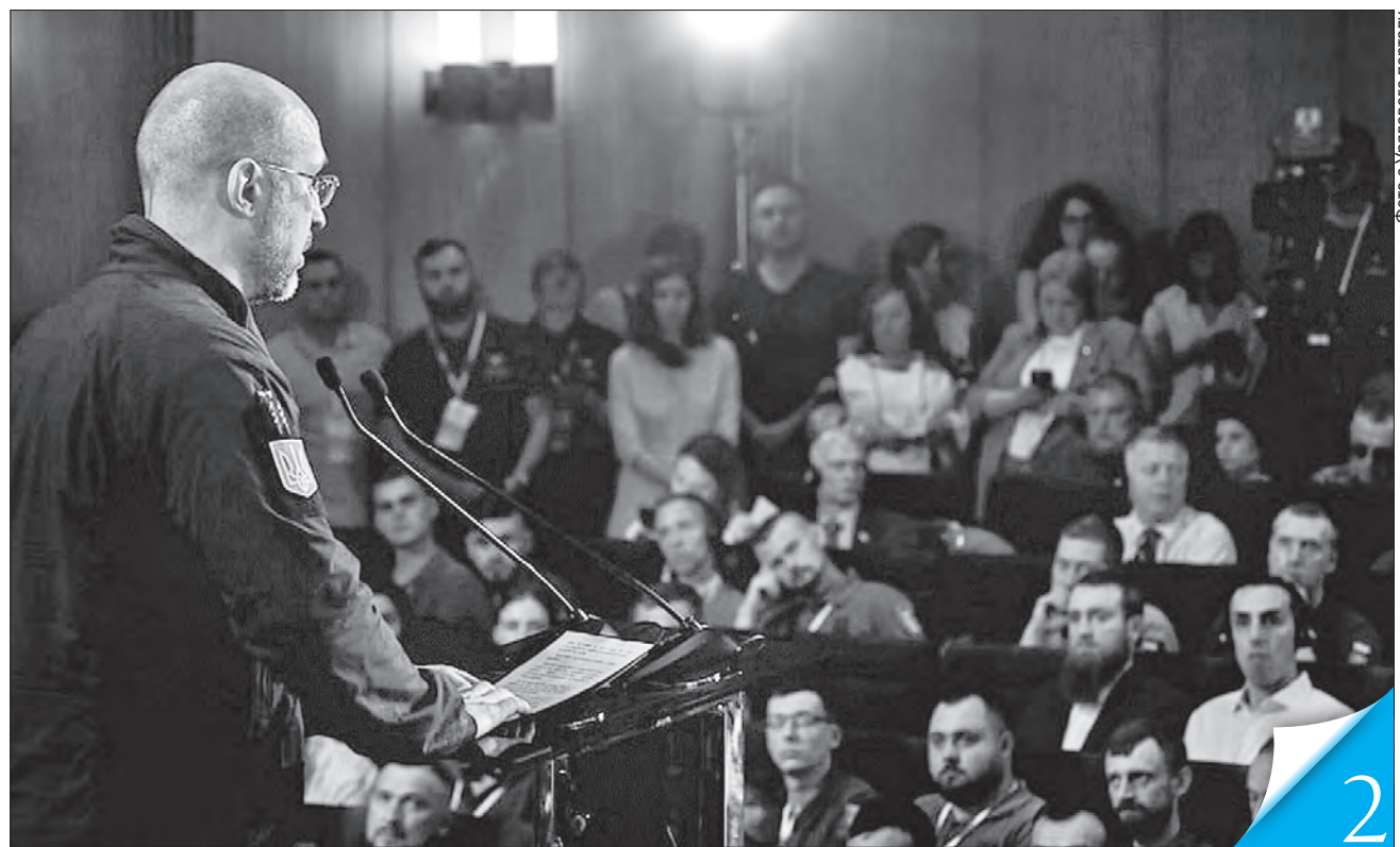
Прем'єр-міністр Денис Шмигаль на форумі означив п'ять ключових елементів державної політики щодо ветеранів

ДЕРЖПІДТРИМКА. Уряд напрацював рішення, щоб захисники і захисниці могли гідно інтегруватися в соціальне життя після повернення з війни