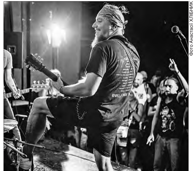
... а шанувальники шаленіють від гучних і ритмічних рифів його гітари

Окремо люди докидали ще на банківську картку. Кожну гривню буде спрямовано за призначенням, запевняє командир медроті: «Загалом завдяки волонтерам маємо змогу працювати нашим підрозділом в повному обсязі — і щодо забезпечення роботи, і щодо облаштування побуту побратимів».