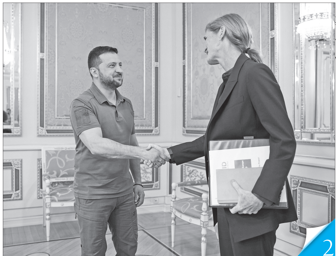
Глава держави подякував Саманті Пауер за безпрецедентну підтримку, яку надають Сполучені Штати й агентство зокрема