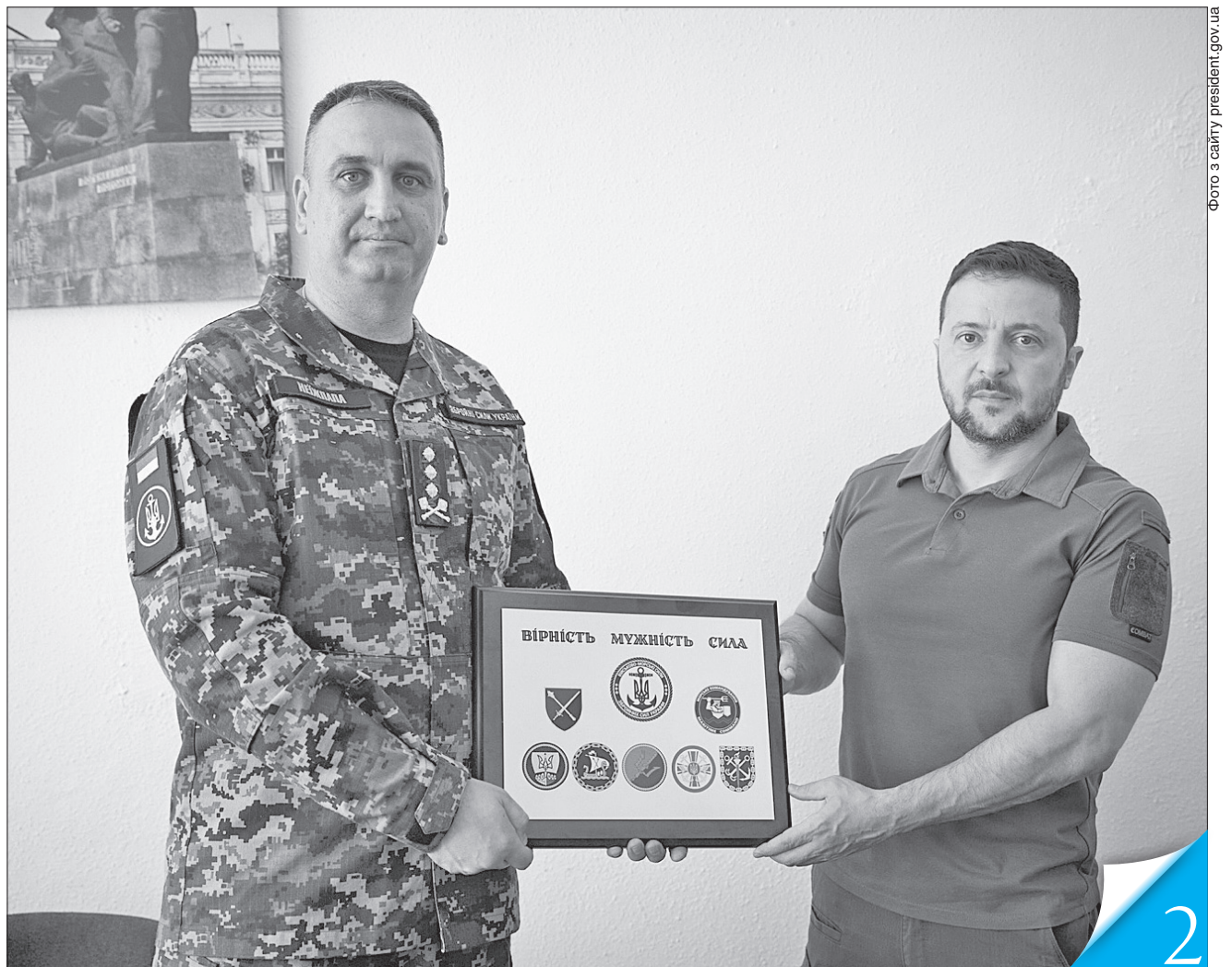
Командувач ВМС України Олексій Неїжпапа доповів Президентові про стратегію розвитку Військово-Морських сил ЗСУ на час війни та в повосенний період

ДЕНЬ ВМС. Президент Володимир Зеленський подякував воїнам Військово-Морських сил ЗСУ за їхній героїчний внесок у наближення перемоги