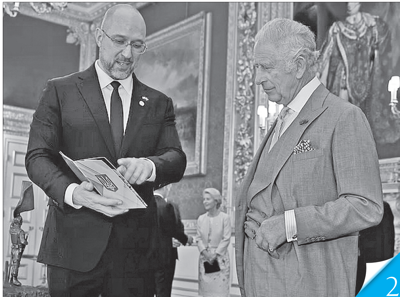
Глава українського уряду подарував Його Величності Королю Чарльзу III бронзову статуетку із зображенням воїна, що стискає український прапор, як символ «взаємної перемоги» України і Великої Британії над росією

ВЕЛИКА ВІДБУДОВА. У Лондоні проходить міжнародна конференція, присвячена відновленню України