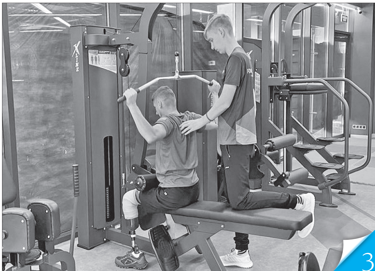
Реабілітація у сучасному комфортному середовищі з досвідченими фахівцями дає змогу пораненим оборонцям краще відновитися

ТУРБОТА. На Харківщині започаткували програму безкоштовної реабілітації поранених військових з ампутаціями