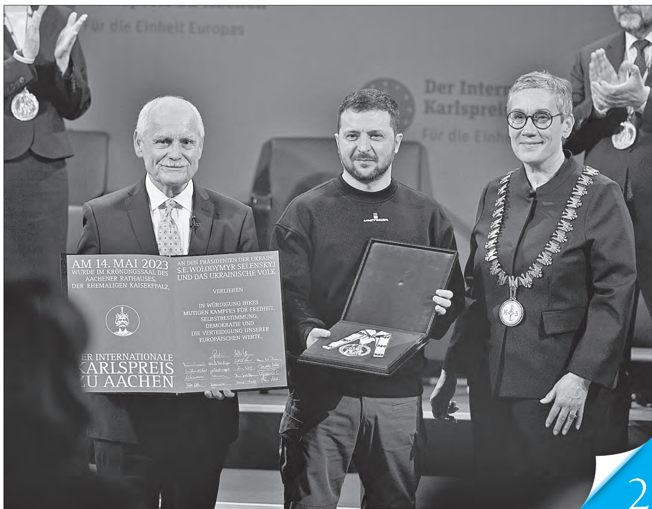
У німецькому місті Аахен Володимиріві Зеленському вручили Міжнародну премію імені Карла Великого, присуджену українському народові за внесок у зміцнення європейської єдності та захист свободи на континенті

ВІЗИТИ ЗАДЛЯ ПЕРЕМОГИ. Серія недавніх закордонних поїздок Президента Володимира Зеленського надає нашій державі дедалі більше підтримки