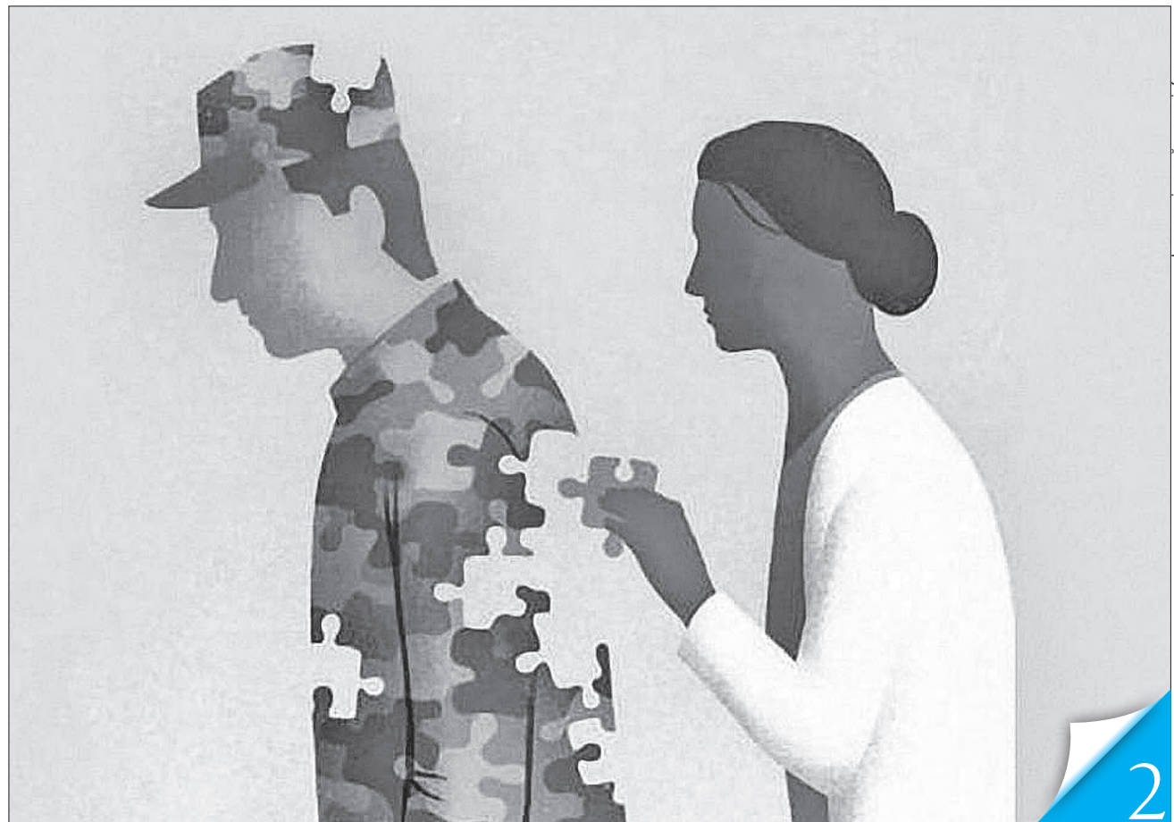
Міністерство оборони реалізовуватиме проєкт «Створення системи психологічного відновлення особового складу Збройних сил України RECOVERY», спрямований на психологічне відновлення військовослужбовців і членів їхніх сімей