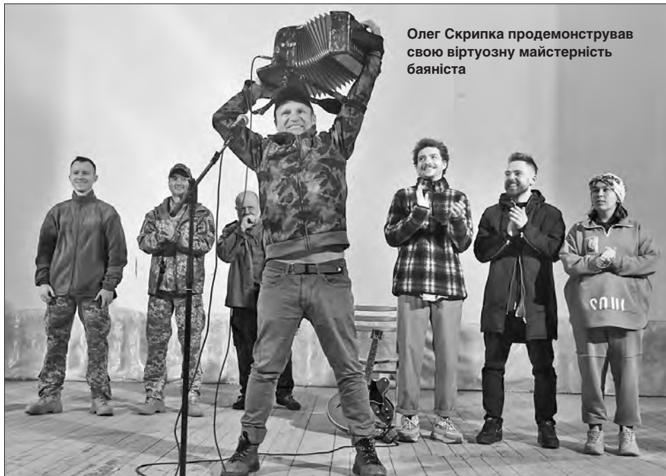
Олег Скрипка продемонстрував свою віртуозну майстерність баяніста

А головна інтрига полягала в натяку, який ще перед концертом з'явився на сцені. То був червоний баян. А хто майстерно володіє цим інструментом і водночас глядацькою увагою? Хто розхитує маси людей словами «Весна, весна, весна, прийде...»? Легенда українського року Олег Скрипка.