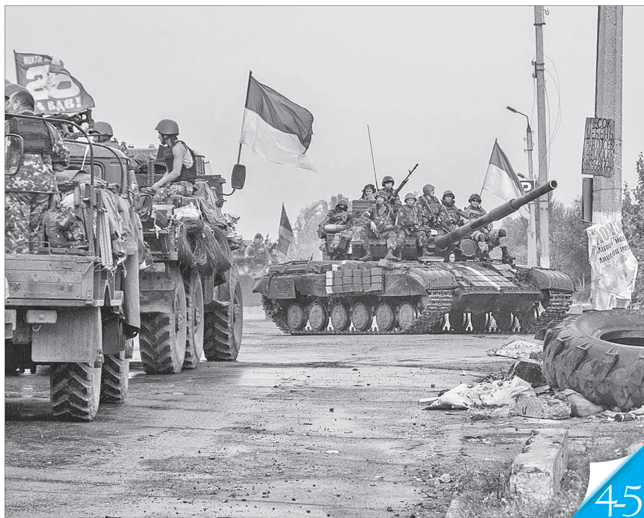
Навесні 2014 року українські військові та особовий склад інших сил оборони України успішно витіснили окупантів з рідної землі

ХРОНОЛОГІЯ ВІЙНИ. «Урядовий кур'єр» продовжує публікації в межах проєкту, започаткованого спільно з військовими журналістами управління зв'язків з громадськістю ЗСУ