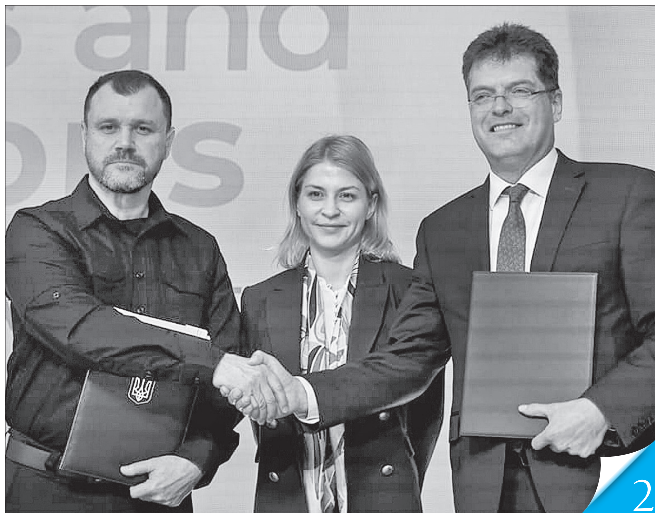
Угоду про участь України в Механізмі цивільного захисту ЄС у присутності віцепрем'єра Ольги Стефанішиної підписали міністр внутрішніх справ Ігор Клименко і єврокомісар Янез Ленарчич

ФОРУМ. За підсумками Міжнародного саміту міст та регіонів підписано спільну декларацію й важливі угоди