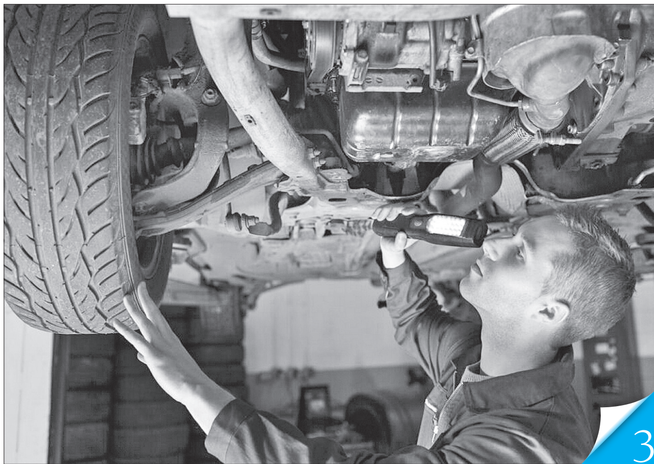
Ремонт і технічне обслуговування автомобілів — в лідерах запитів від охочих працювати на новому місці

ПРАЦЕВЛАШТУВАННЯ. Із початку повномасштабної війни на Черкащині за сприяння служби зайнятості знайшли роботу 778 внутрішньо переміщених осіб