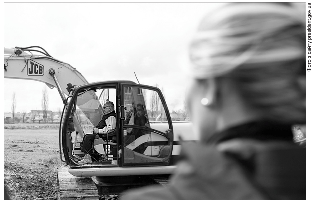
Перший ківш ґрунту на місці початку будівництва підняв на екскаваторі сам меценат проекту

Очікується, що фабрика-кухня в Бучі забезпечить харчуванням три громади (Буча, Немішаєве та Бородянка), де розташовано кілька десятків навчальних закладів. Потужності виробництва можна переналаштувати або розширити для задоволення потреб у харчуванні будь-яких верств