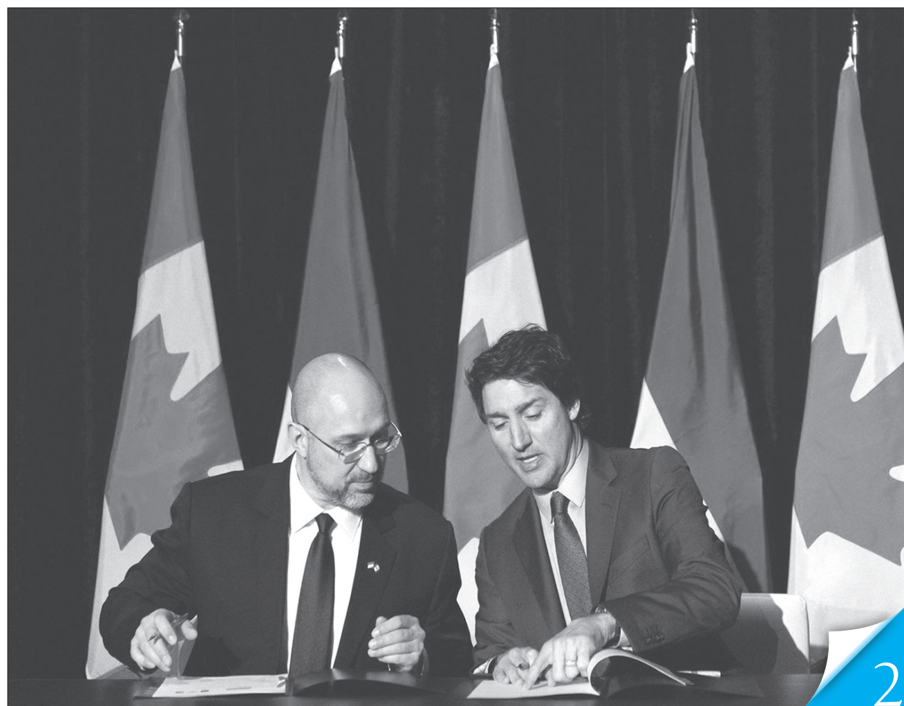
Денис Шмигаль та Джастін Трюдо підписали спільну декларацію про завершення переговорів щодо оновлення угоди про вільну торгівлю між Канадою і Україною

ДОПОМОГА. Прем'єр-міністр Денис Шмигаль наголошує, що наша держава відчуває міцну підтримку і принципову позицію союзника, щоб зупинити агресора