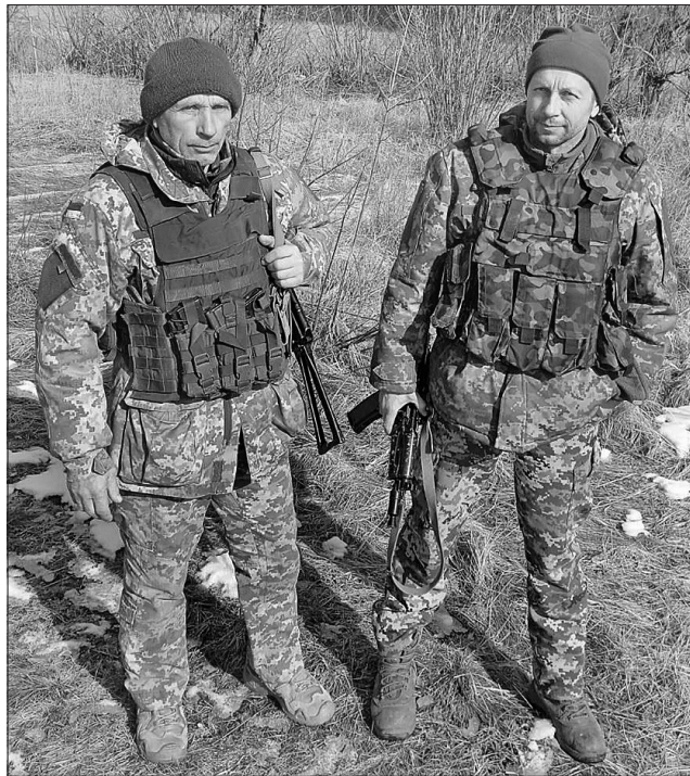
Рідні брати сумують за працею на землі

А брати після вдалого закінчення Макарівської операції опинилися в 46 окремій аеромобільній бригаді ДШВ ЗСУ, з якою пройшли степи Херсонщини, торували шляхи