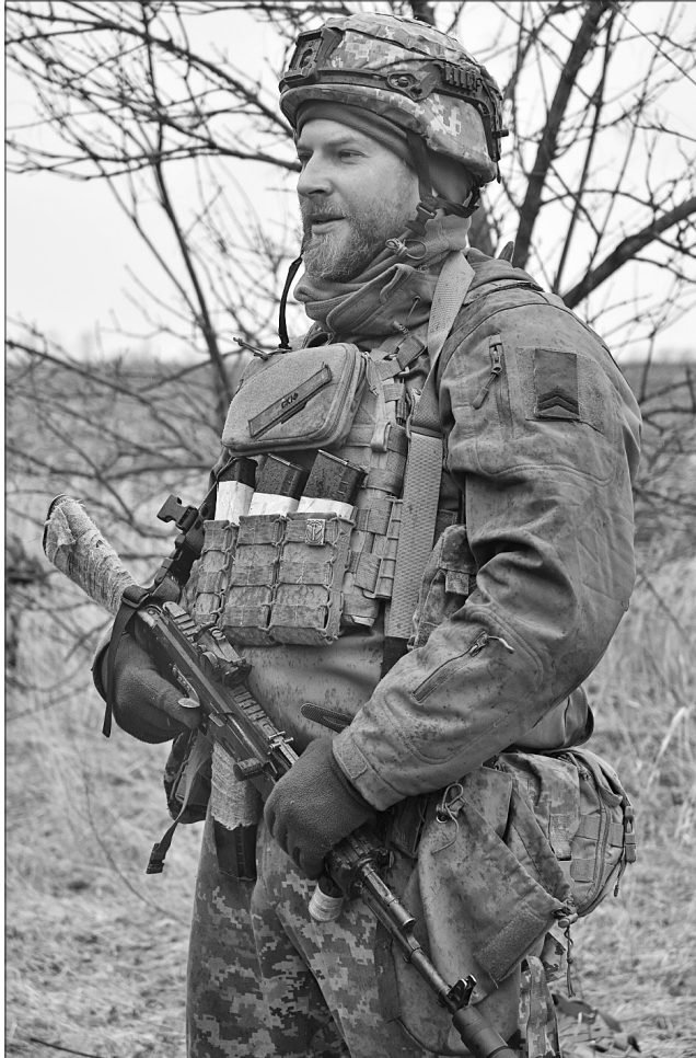
«Скіф» мріє про новітні сторінки історії вітчизняного кіно

Актором мріяв стати ще під час інженерної кар'єри. Йому було затісно у тех-