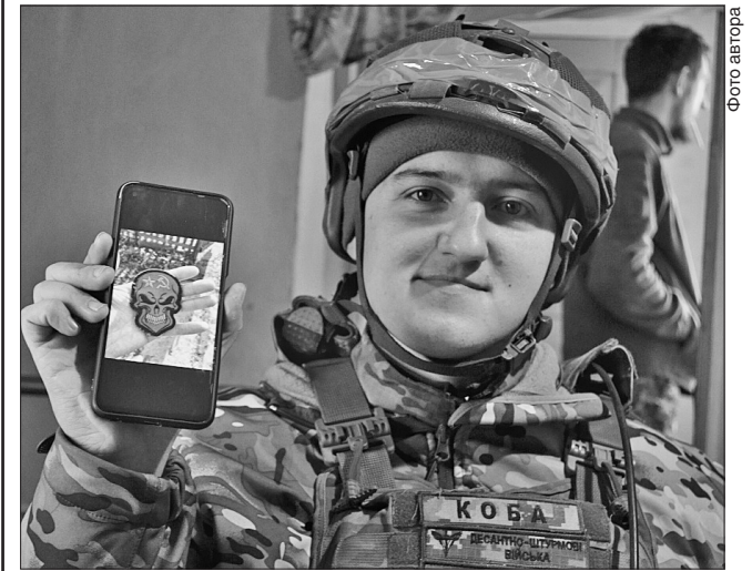
Здобутий ворожий шеврон — не останній у колекції трофеїв