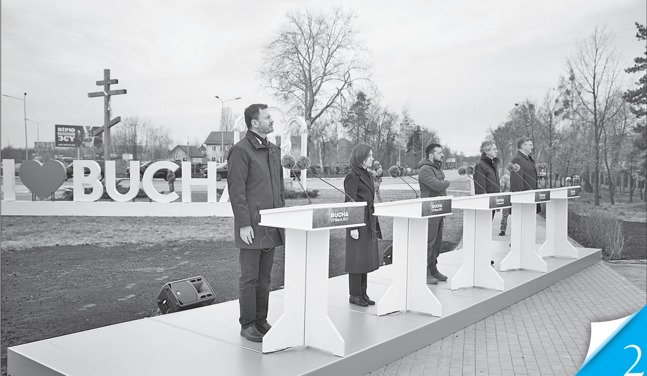
Прем'єр-міністр Словаччини Едуард Хегер, Президент Молдови Мая Санду, Президент України Володимир Зеленський, Прем'єр-міністр Словенії Роберт Голоб та Прем'єр-міністр Хорватії Андрей Пленкович під час пам'ятних заходів у Бучі говорили про необхідність покарання за злочини, які скоїла російська армія

ПАМ'ЯТАЄМО. Учора, в річницю визволення, за участі керівників України та іноземних лідерів у Бучі згадували торішні трагічні сторінки