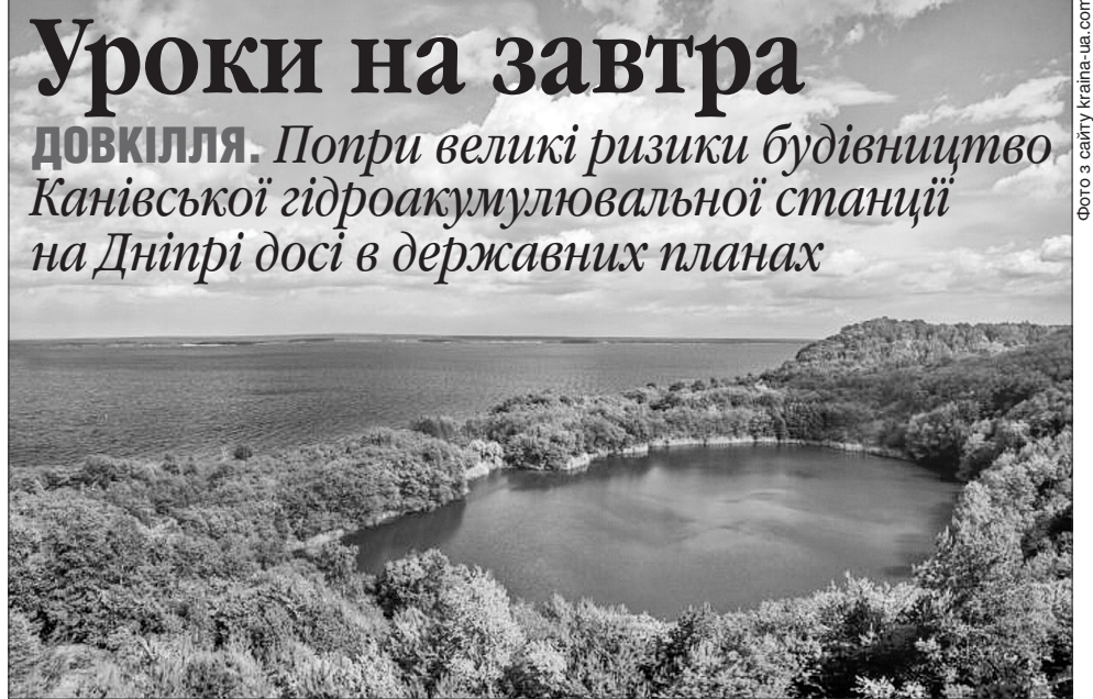
Здається, сама природа чекає на виважене, розумне рішення владців для збереження її самотності

Під час земляних і будівельних робіт на спорудженні ГАЕС, як зауважують місцеві краєзнавці, вже завдано непоправної шкоди окремим археологічним пам'яткам, розташованим поблизу села Бучак. Проте ще два роки тому консультанти Європейського інвестиційного банку — основного міжнародного інвестора проєкту вказували на наявність сучасніших альтернатив з використанням повновлованих джерел енергії. Вони констатували недоліки в документації щодо оцінки впливу на довкілля. Техногенні, екологічні та соціальні ризики, наголошували фахівці, роблять проєкт небезпечним для суспільства і довкілля.