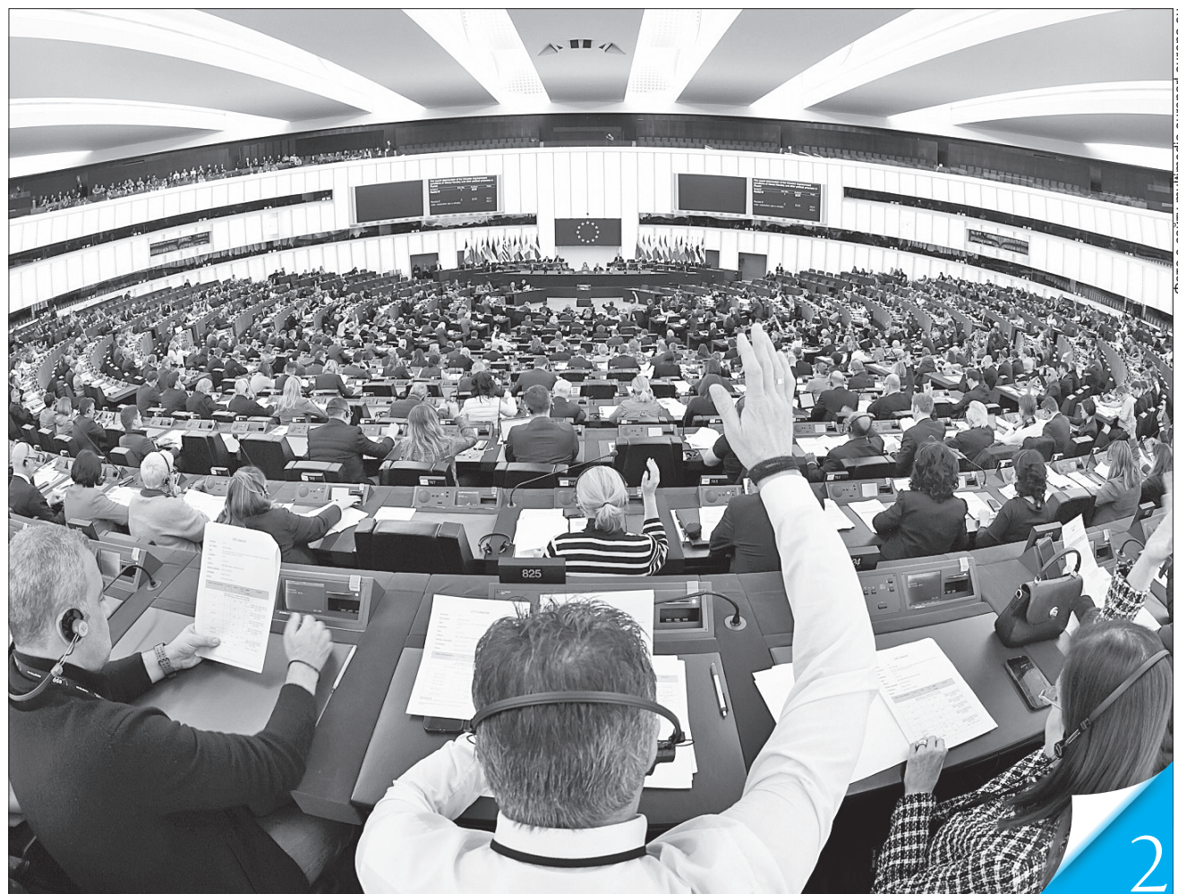
Резолюцію, присвячену річниці російського вторгнення в Україну, підтримали 444 депутати, 26 проголосували проти, 37 — утрималися

ГЕОПОЛІТИКА. Лише «постійне, стабільне та невпинно зростаюче постачання» Україні сучасного західного озброєння дасть змогу перемогти у війні з росією