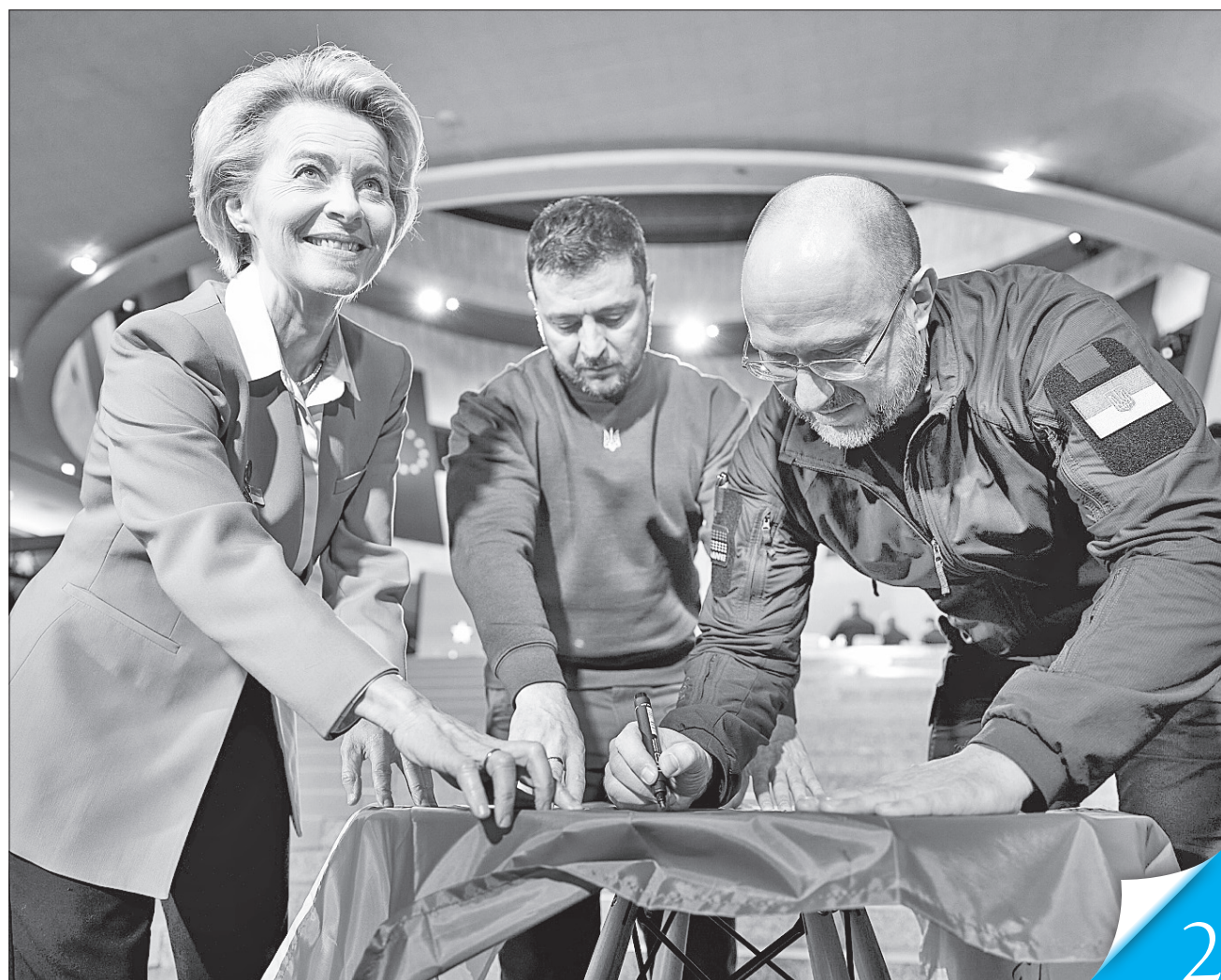
Президент Єврокомісії Урсула фон дер Ляєн, Президент України Володимир Зеленський та Прем'єр-міністр Денис Шмигаль підписали прапори України та Євросоюзу, давши старт спільним консультаціям уряду і Єврокомісії

У ДІАЛОЗІ. Учора відбулися перші в історії нашої держави консультації між вітчизняним урядом та Колегією Європейської комісії