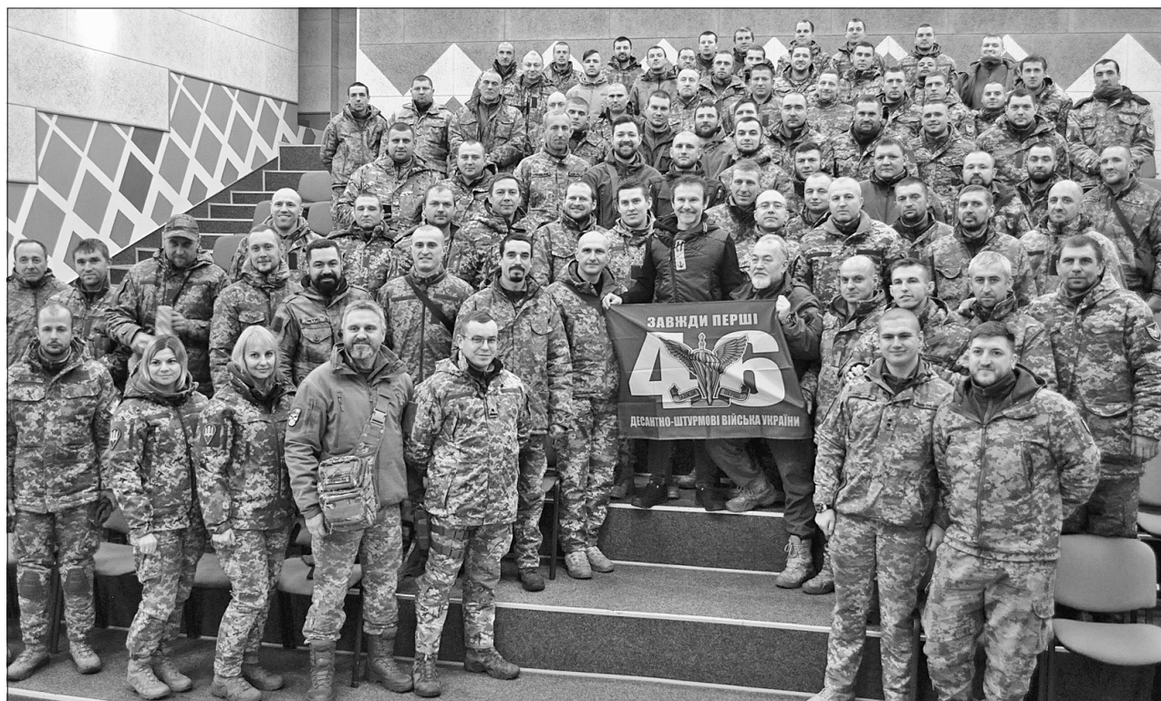
Колективне фото на згадку про зворушливі моменти зустрічі

Саме тому назви бойових підрозділів, зокрема вашого, які визволяють нашу землю від російських окупантів, буде золотими літерами вписано в новітню історію України».