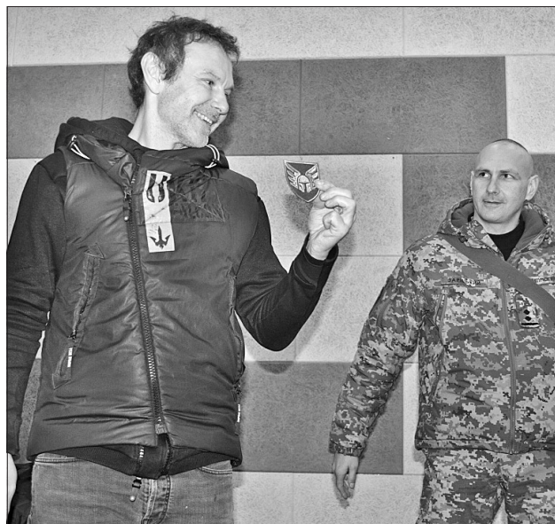
Серед інших подарунків Святослав Вакарчук отримав навуковий знак 46 оаебр

«Вогню вам у серцях, холодного розрахунку в головах і фортуни», — побажав Святослав Вакарчук українським десантникам.