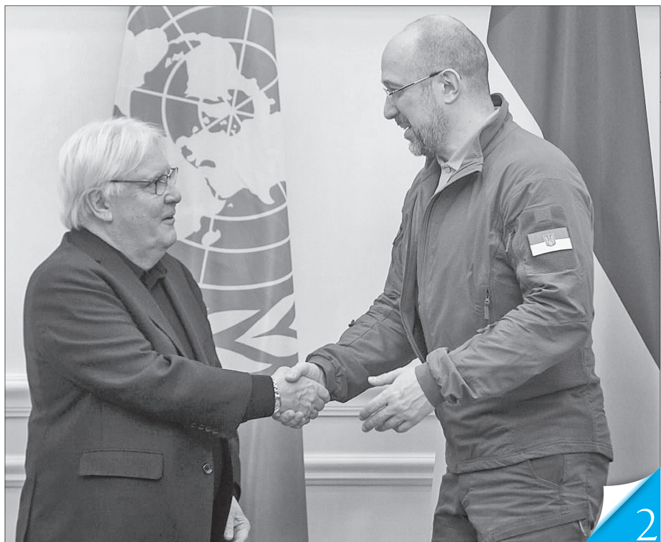
Прем'єр-міністр Денис Шмигаль і заступник Генсека ООН Мартін Гріффітс домовилися про активну співпрацю за різними напрямками

СОЛІДАРНІСТЬ. ООН планує розширювати гуманітарні програми допомоги українцям наступного року