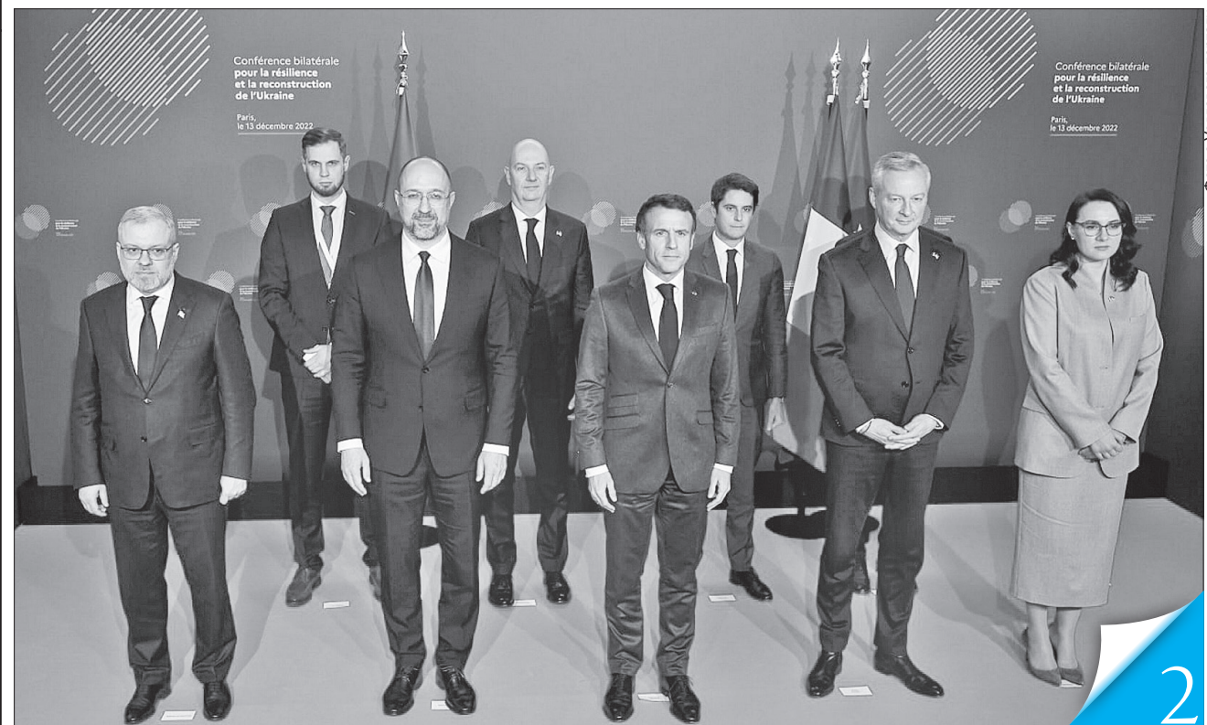
Форум з економічної стійкості та реконструкції України зібрав лідерів, урядовців та бізнесменів двох країн

СОЮЗНИКИ. Міжнародна конференція «Солідарність з українським народом» і Форум з економічної стійкості та реконструкції України, які відбулися в Парижі, об'єднали партнерів для конкретної допомоги