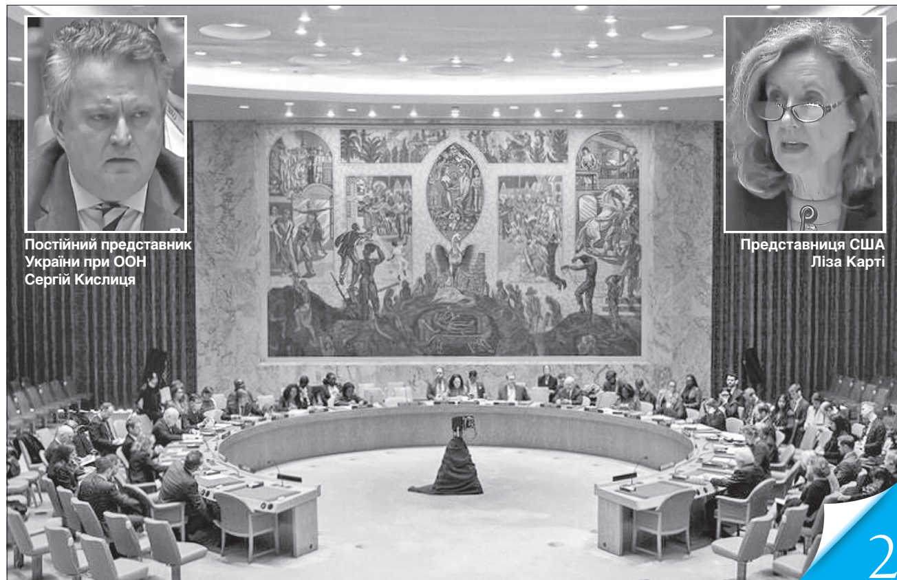
Рада Безпеки ООН провела спеціальне засідання, присвячене гуманітарній ситуації в Україні

МІЖНАРОДНА ТРИБУНА. Світ уже має думати про модальність переговорів з росією «без путіна». Бо в Україні немає жодних ілюзій щодо готовності кремля до миру