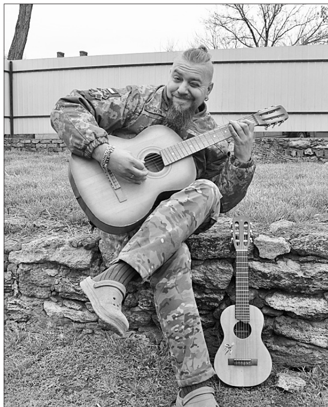
Командир медроти часто розважає підлеглих грою на гітарах