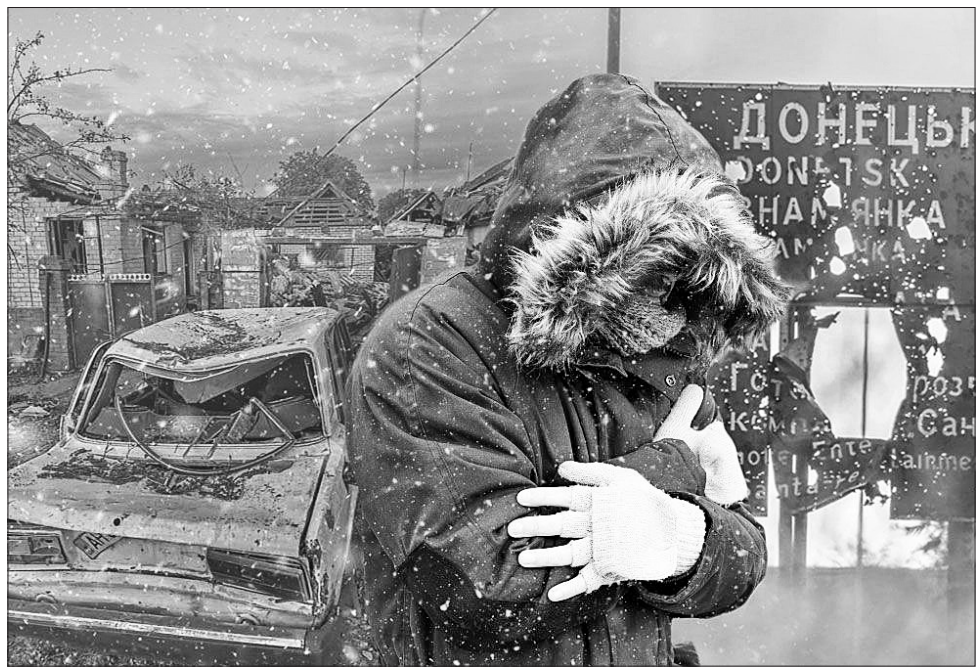
Через щоденні обстріли жителі області змушені виживати без електрики, газу, тепла, води

Військові аналітики не перестають дивуватися тактичній примітивності зусиль агресорів на цьому напрямку, які давно зайшли для них у глухий кут. Тобто подальші дії російських генералів та головного кремлівського геополітика свідчать, що вони не зробили жодних висновків із попередніх невдач наступів на інших напрямках, приміром біля Лисичанська та Северодонецька, які призвели до великої кількості жертв. Сповідуючи жорстокий метод «перемога за будь-яку ціну», в москві відмовляються зрозуміти, що величезні витрати і втрати військового потенціалу «другої у світі армії» не