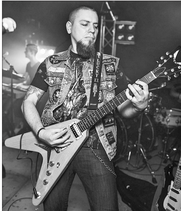
Панк-рок — то справа серйозна

А з іншого боку, здавалося б, який стосунок має організація корпоративів чи інших свят (до чого був безпосередньо причетний у мирний час) до командування