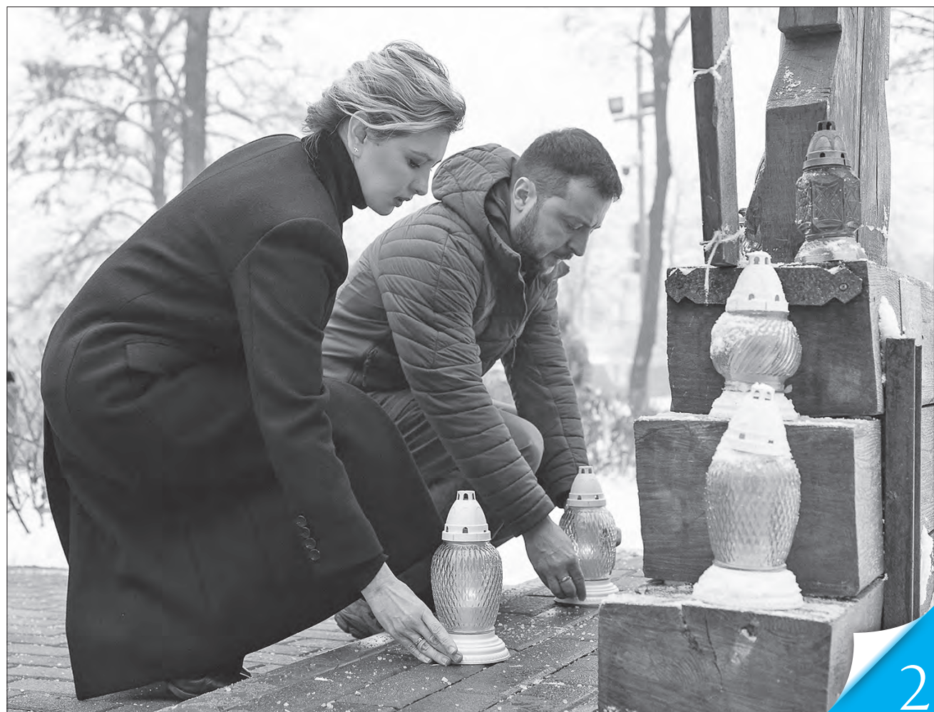
Президент Володимир Зеленський разом з дружиною Оленою вшанував пам'ять активістів, які загинули під час Революції Гідності

МИ ВИСТОЇМО! Президент Володимир Зеленський звернувся до Українського народу з нагоди знаменної дати — початку Помаранчевої революції та Революції Гідності