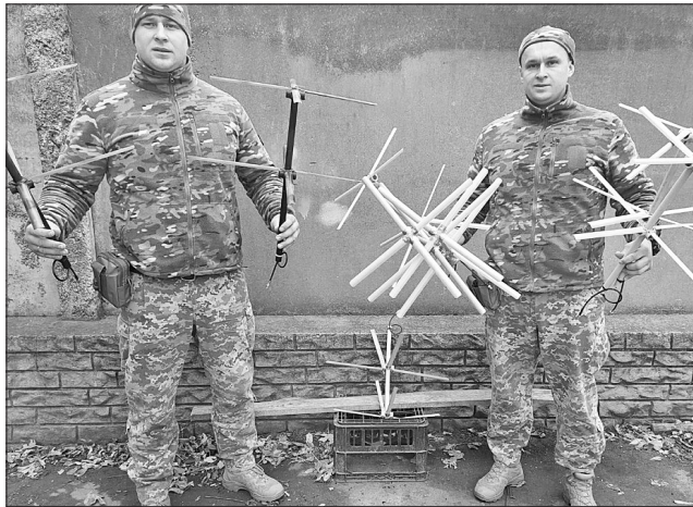
Брати-військові швидко й на високому рівні опанували виготовлення антен для американських радіостанцій