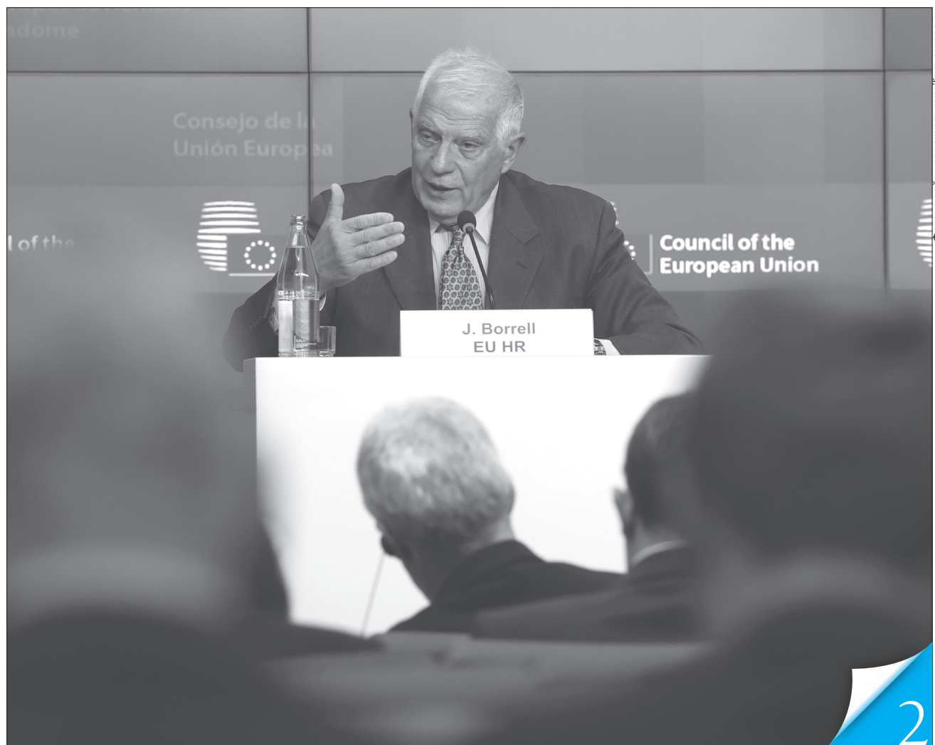
Верховний представник ЄС Жозеп Боррель наголошує, що Єросоюз підтримуватиме Україну стільки, скільки буде потрібно

ГЕОПОЛІТИКА. Європа вивчає можливість накладати санкції також на Іран за постачання дронів для атаки українських міст