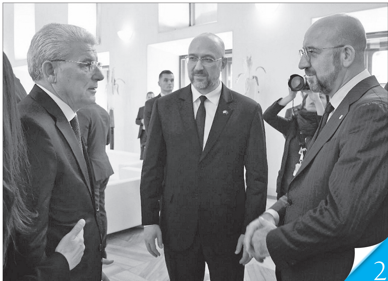
Голова Президії Боснії та Герцеговини Шефік Джаферович, Прем'єр-міністр України Денис Шмигаль та Президент Європейської ради Шарль Мішель обмінюються думками на полях Європейської політичної спільноти

СИЛА ЄДНОСТІ. Завдяки новій ініціативі з'явився не просто ще один формат співпраці цивілізованих демократичних країн