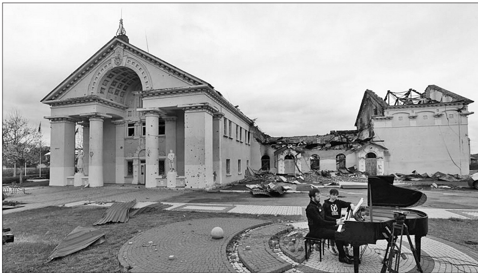
Пошкоджений будинок культури міста Ірпін

За словами директора з корпоративного управління і конт-