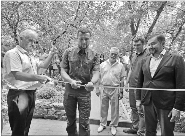
На відкриття лісовничо-просвітницького центру завітали керівники лісівничої й освітянської галузей України

«Лісове господарство — це виробнича галузь, яка потребує фахівців з належною підготовкою, — відкриваючи центр, зазначив ректор вишу Стані-