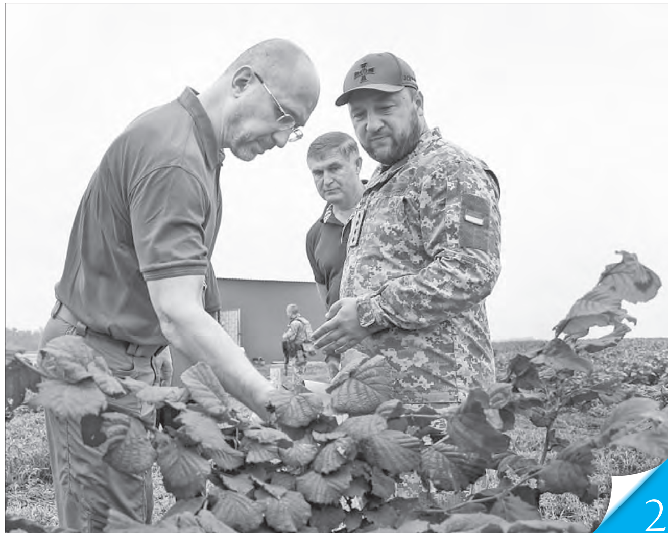
Глава уряду відвідав одне з фермерських господарств на Київщині, яке подало заявку на грантові кошти за програмою «Робота» і отримало позитивне рішення

РОБОЧА ПОЇЗДКА. На Київщині та Черкащині Прем'єр-міністр Денис Шмигаль на власні очі пересвідчився в дієвості владних ініціатив