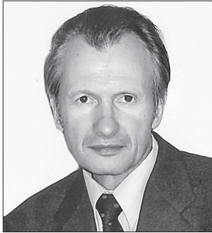
Матеріали Володимира Ткаченка часто публікував «Урядовий кур'єр»

Володимир ЧКАЛІН для «Урядового кур'єра»