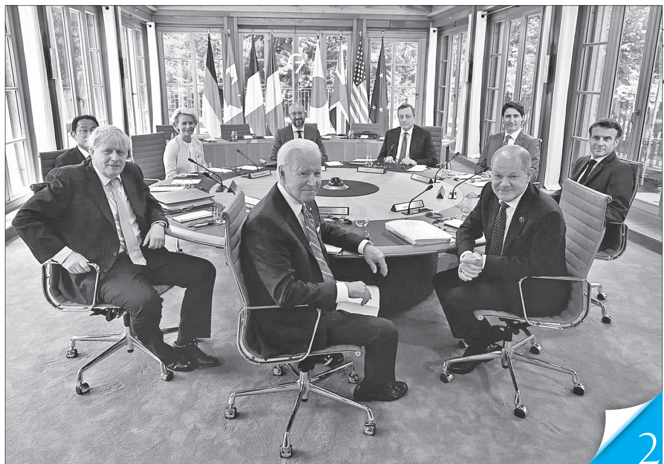
Лідери Великої Британії, Італії, Канади, Німеччини, США, Франції та Японії, а також керівники Євросоюзу обговорювали агресію росії, яка спричинила загрозу голоду та енергетичну кризу

ГЕОПОЛІТИКА. Саміт G7 — потужний сигнал кремлю, що найвпливовіші держави світу підтримуватимуть нас до повної перемоги