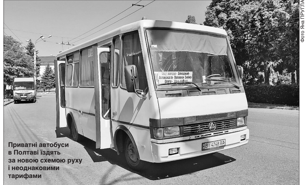
Приватні автобуси в Полтаві їздять за новою схемою руху і неоднаковими тарифами

За логікою речей, після всіх подій, які відбулися за останній місяць на ринку перевезень приватними автобусами Полтави, всі учасники недавнього конфлікту мали б зітхнути з