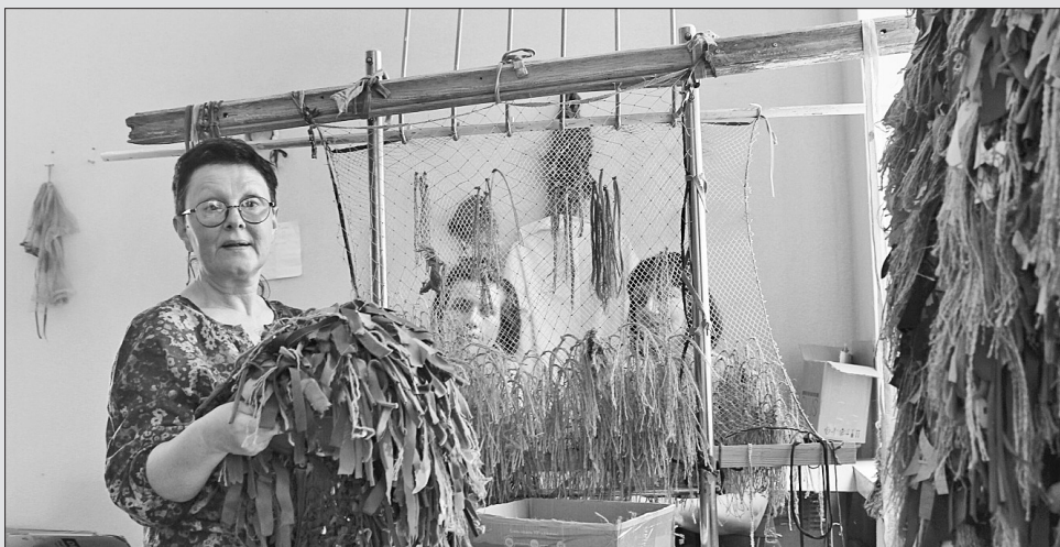
А матері плетуть... Перемогу

«Я вже, мабуть, дисертацію можу захистити про цих кікімор та лісовиків. Багато в чому інтернет допоміг, щось засвої-