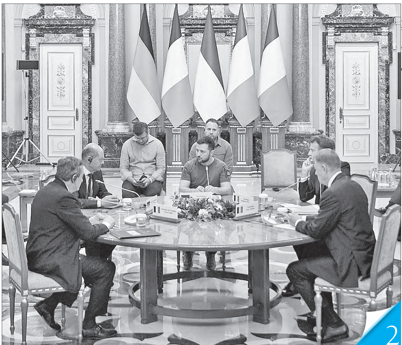
Прем'єр Італії Маріо Драгі, Канцлер ФРН Олаф Шольц, Президент України Володимир Зеленський, Президент Франції Еммануель Макрон та Президент Румунії Клаус Йоганніс обговорювали не лише нашу європерспективу

ПІДТРИМКА. Лідери Франції, Німеччини, Італії та Румунії підтримують негайне надання нам статусу країни-кандидата на вступ в ЄС