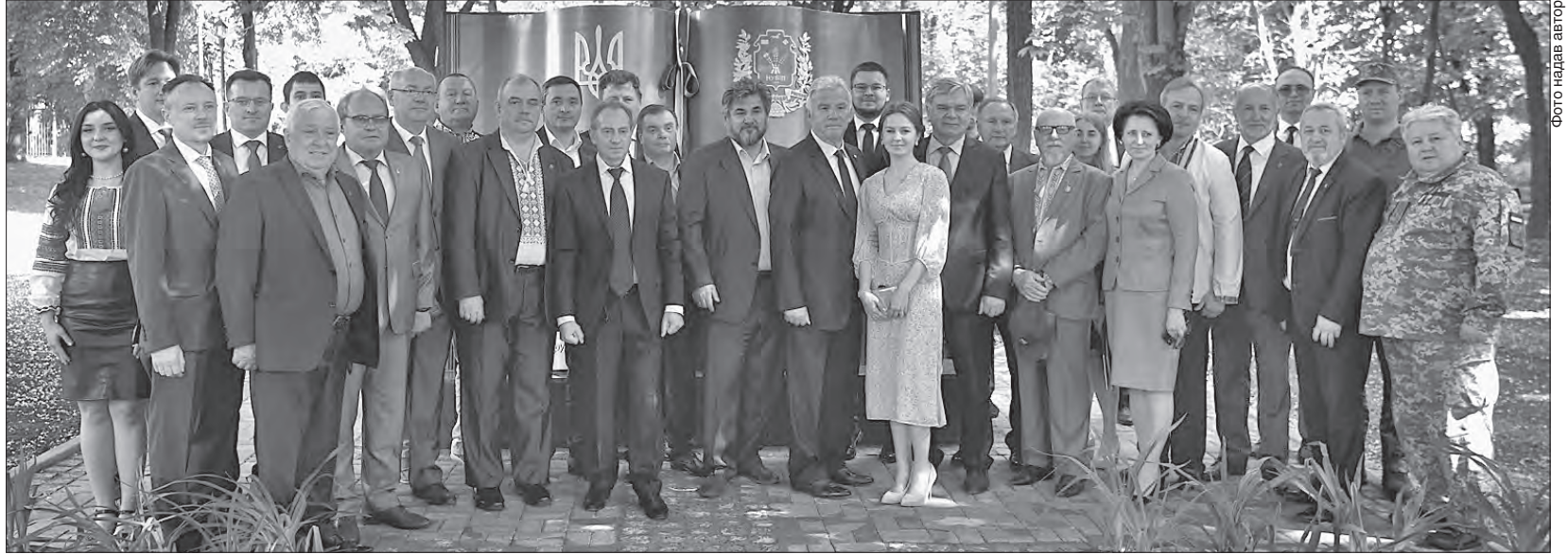
Колектив університету тримає стрій і на фронті, і в тилу у навчальному процесі

На алеї Слави університету відкрили Книгу знань НУБіП України. До реалізації цього задуму долучили-