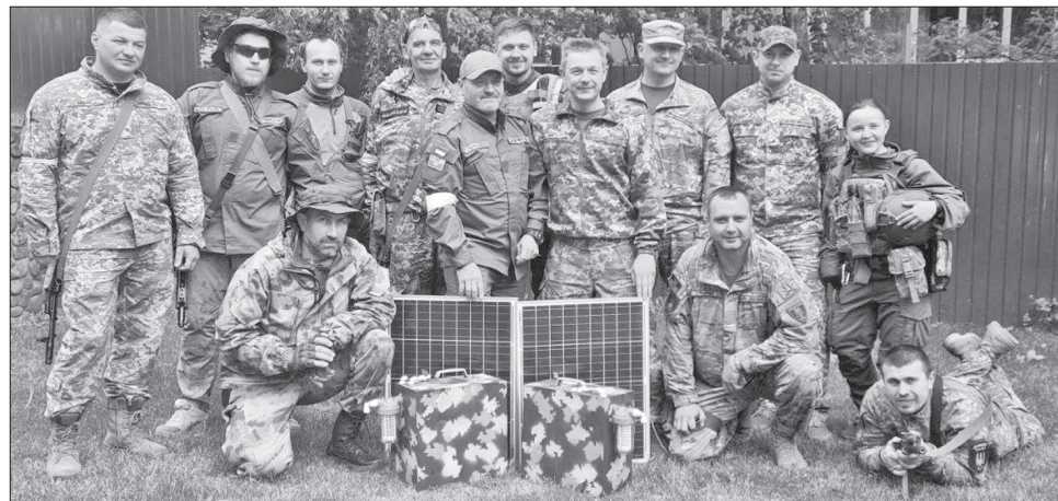
Інноваційні пристрої допоможуть бійцям в екстремальних умовах

Боець 204 батальйону з позивним «Хімік» розповідає про цей пристрій: «Він компактний і не помітний у траві завдяки піксельному забарвленню. Безперечно, дасть змогу отримати безпечну воду для бійців. Систему розроблено так, що вона має автономію від стандартного електричного живлення і надає з будь-яких джерел високоякіс-