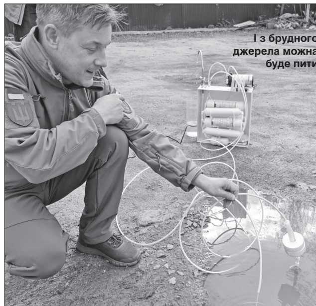
І з брудного джерела можна буде пити

«Хімік» зазначає, що вода чи то з калюжі, чи то з болота, чи з будь-якого іншого брудного джерела (навіть отруєного миш'яком колодязя тощо) буде не просто повністю очищена, а ще й збагачена корисними мінералами, вільна від радіонуклідів (зниження радіації досить високе). Також мати-