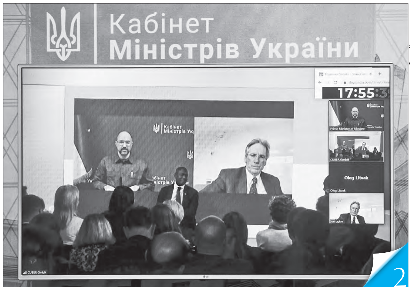
Прем'єр подякував міжнародним компаніям, які пішли з російського ринку, запропонувавши їм планувати інвестиції та відкриття виробництв в Україні

ПРІОРИТЕТИ. Основу оновлення нашої держави формуватимуть національна безпека, інтеграція в ЄС та економічна трансформація