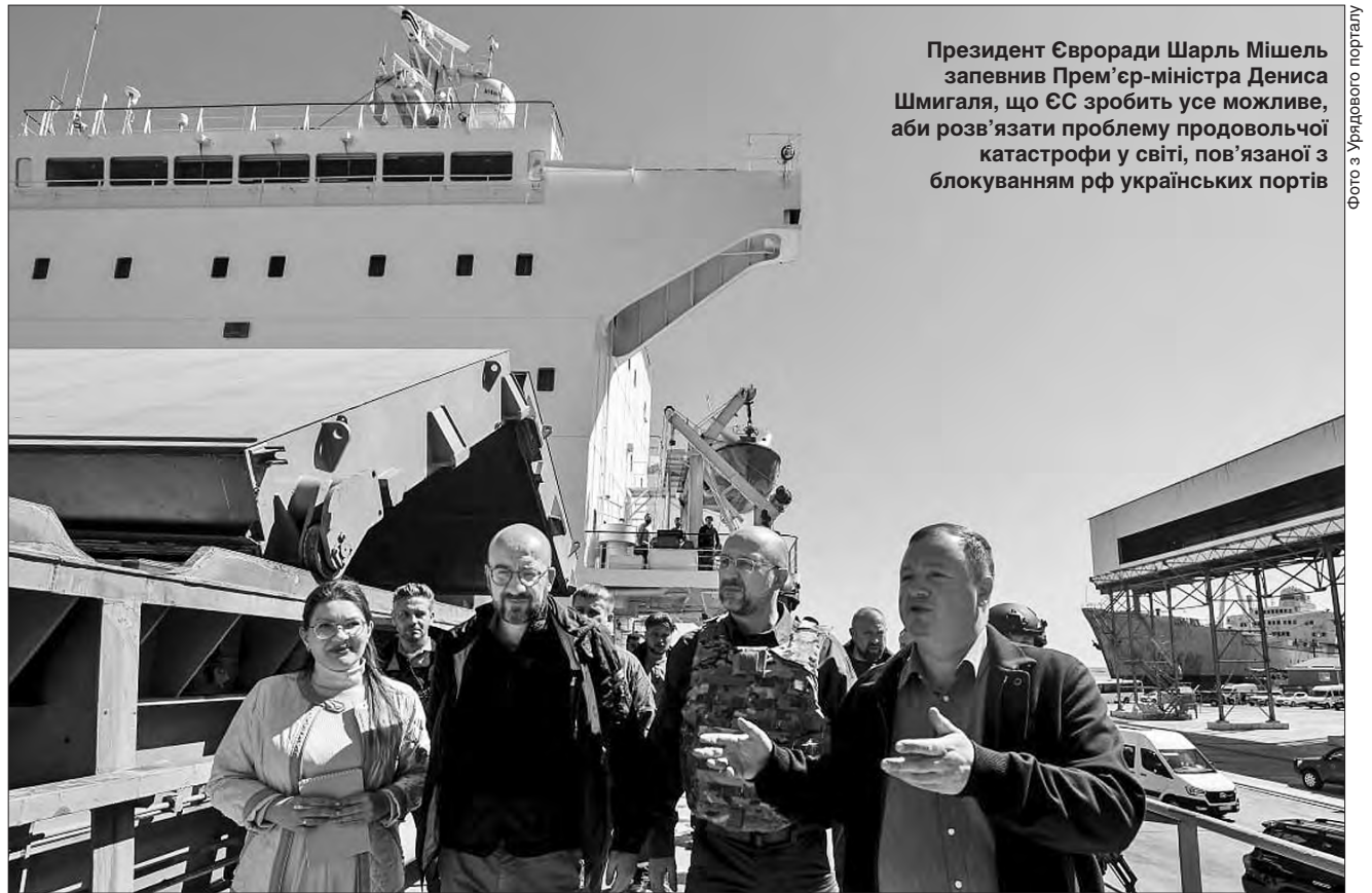
Президент Євроради Шарль Мішель запевнив Прем'єр-міністра Дениса Шмигаль, що ЄС зробить усе можливе, аби розв'язати проблему продовольчої катастрофи у світі, пов'язаної з блокуванням РФ українських портів

ВІЗИТ ПІД ОБСТРІЛАМИ. ЄС зробить усе, щоб допомогти нашій країні зупинити російську воєнну машину