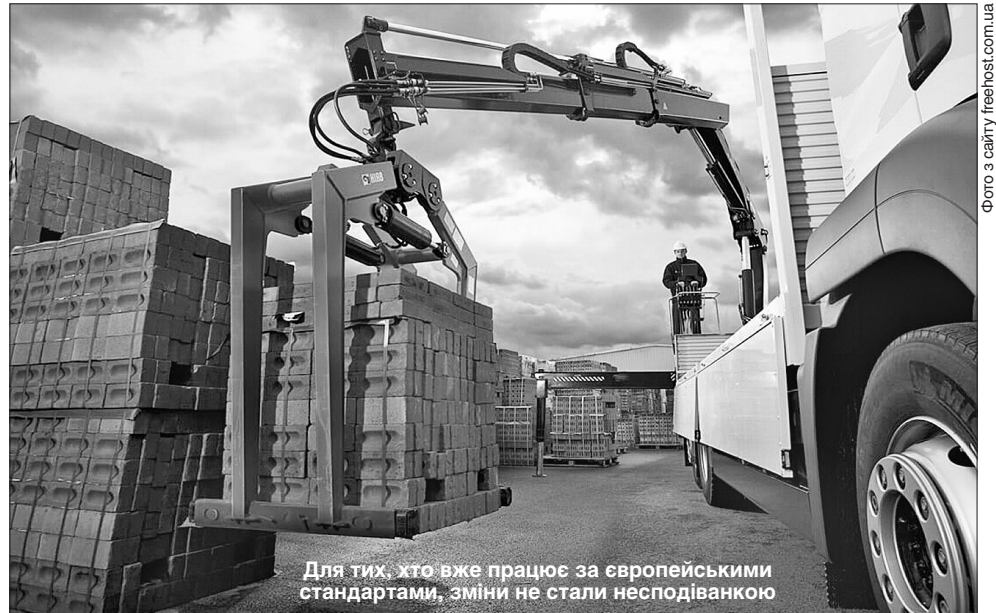
Для тих, хто вже працює за європейськими стандартами, зміни не стали несподіванкою

«Раніше виробники будівельної продукції не були зобов'язані декларувати характеристики своєї будівельної продукції, тобто їм не потрібно було заповнювати відповідні декларації та вносити їх в електронну систему. Проте внаслідок ухвалення вищезгаданого закону запроваджується обов'язок виробника під час введення будівельної продукції в обіг скласти декларацію показників такої продукції. Згідно з вищезгаданою постановою уряду, було встановлено форму такої декларації