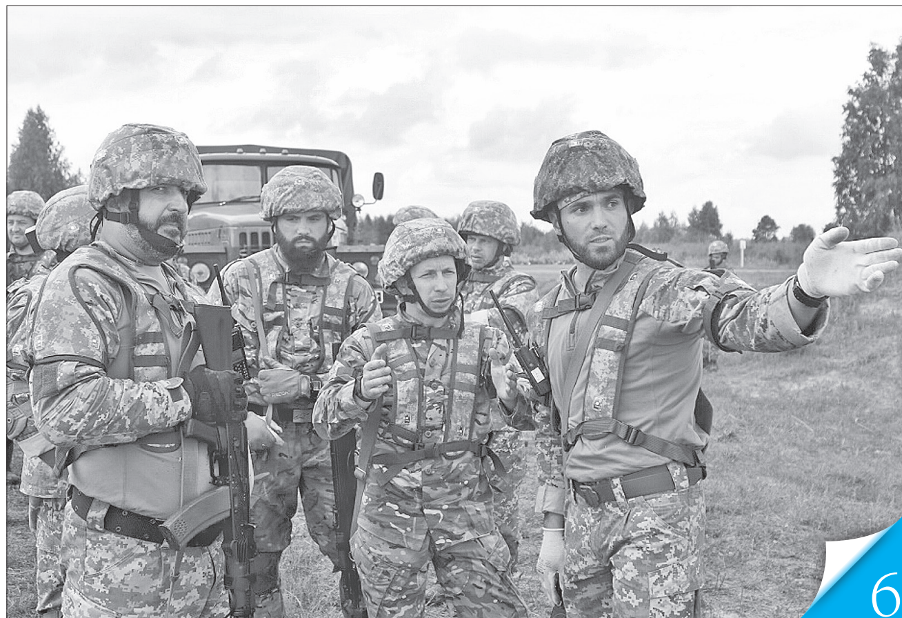
Військові у штатному розписі тероборони мають бути відповідальними і морально стійкими, готовими до будь-якої ситуації, адже їм належить працювати з цивільними у незвичних умовах

ЗАХИСТИМО УКРАЇНУ! На Закарпатті діятимуть сім батальйонів