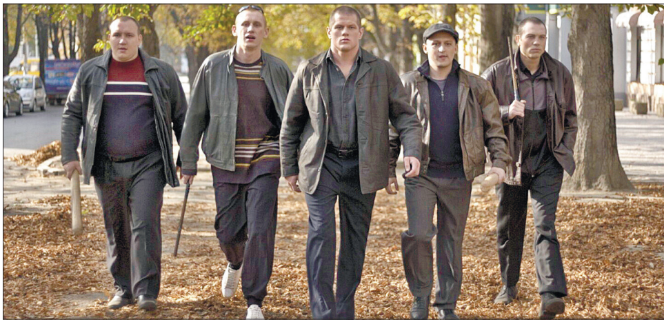
На відміну від колег режисер Сенцов не романтизує описаний час і не ностальгує за ним (кадр з фільму)

Жив у невеликому місті хлопчина, і звали його Вова. Як усі хлопці, він час від часу бився на вулиці, але вже тоді вирізнявся силою й особливо жорстокістю. Він подорослішав, пережив армійську службу в Афганістані і став авторитетом «на районі». У нього вже своя бригада, яка тероризує бізнес-