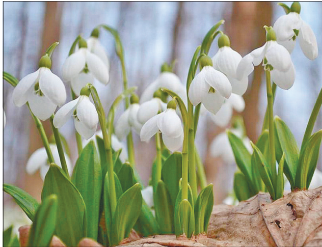
Милують око перші підсніжники в Канівському природному заповіднику

Почастило науковцям цими днями зустріти сокола, який повернувся в рідні місця на Чер-