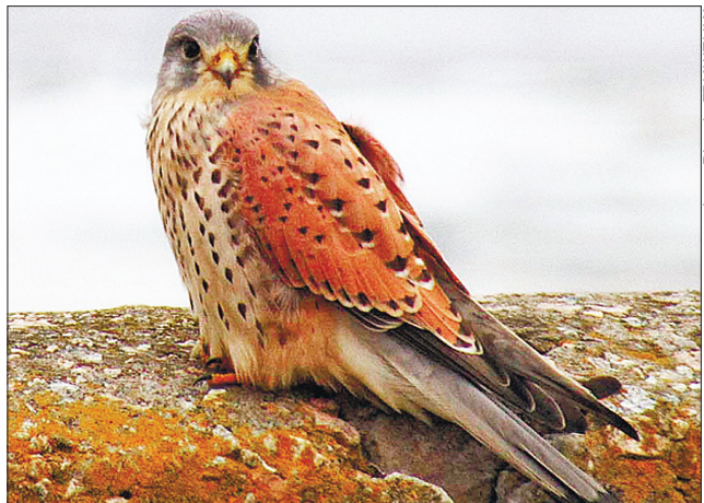
Нічого не сховається від соколиного ока боривітра

галявинах Холодного Яру під Чигирином. Незабаром розіллються вони суцільним зеленобілим килимом, салютуючи світтанкові року. Завдяки спільній роботі природоохоронців та громадських активістів, зокрема студентів, популяцію підсніжника тут вдається зберігати й примножувати. Незабаром ліс наповниться голосами туристів, які щороку приїжджають сюди помилуватися первоцвітами. Недавно створений Національний природний парк «Холодний Яр» ретельно охороняє своє біорізноманіття, захищає рідкісні види флори і фауни.