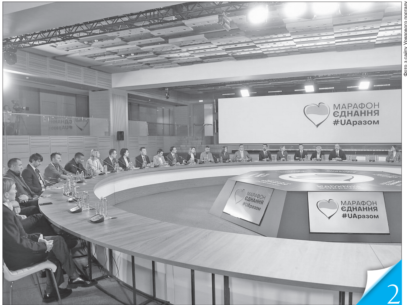
Прем'єр-міністр Денис Шмигаль взяв участь у загальнонаціональному марафоні єднання #UАразом

РАЗОМ. У День єднання українці продемонстрували це і друзям, і ворогам