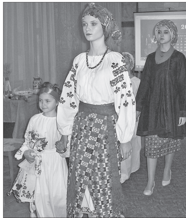
Зразки одягу, який полтавки носили століття тому